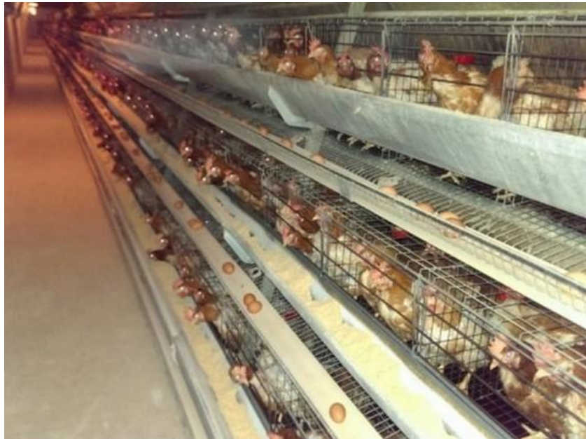
Slika 2. Kavezni način uzgoja (Izvor: www.agroklub.com )