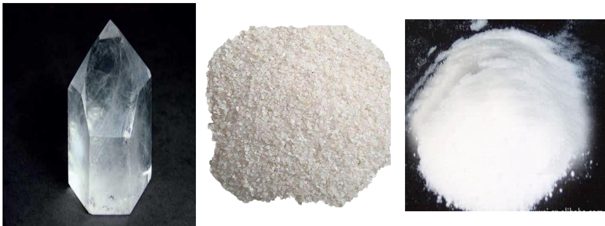
Slika 2.3.1.2. Različite forme kvarca - kristal, pijesak, prah

Prah se zatim miješa s vodom dok se ne dobije čvrsta pasta. Nakon punjenja roga pastom kvarca, rog se zakopava u tlo gdje ostaje šest mjeseci tijekom ljetnog razdoblja. Nakon tog perioda rog se iskopava iz tla, a pripravak 501 vadi iz roga. Dobiveni pripravak može se koristiti ili skladištiti (Bacchus, 2010; Waldin, 2016).