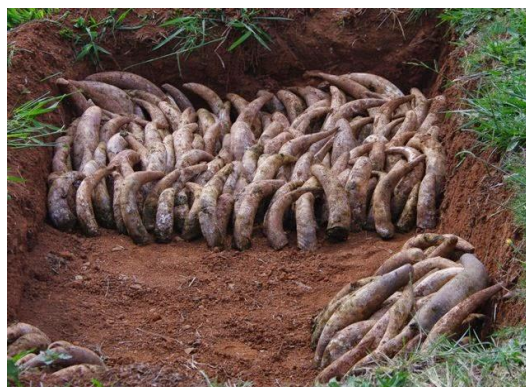
Slika 2.3.1.1. Način zakapanja rogova pri izradi biodinamičkog pripravka 500

Gnoj iz kravljeg roga važan je dio biodinamičke poljoprivrede. Izrađuje se od kravljeg gnoja kojim se puni kravljji rog te se potom ukapa u tlo, gdje se ostavlja tijekom šest mjeseci u hladnom dijelu godine. Rogovi se u tlu postavljaju uspravno (slika 2.3.1.1.) kako bi se u njima izbjeglo prekomjerno nakupljanje vlage. Nakon iskapanja rogova i vađenja preparata dobiva se tamna zrnata supstanca koja sadrži populaciju korisnih mikroorganizama u mnogo većem broju od običnog komposta ili dobrog tla. Preparat se nakon iskapanja može koristiti ili skladištiti (Waldin, 2016).