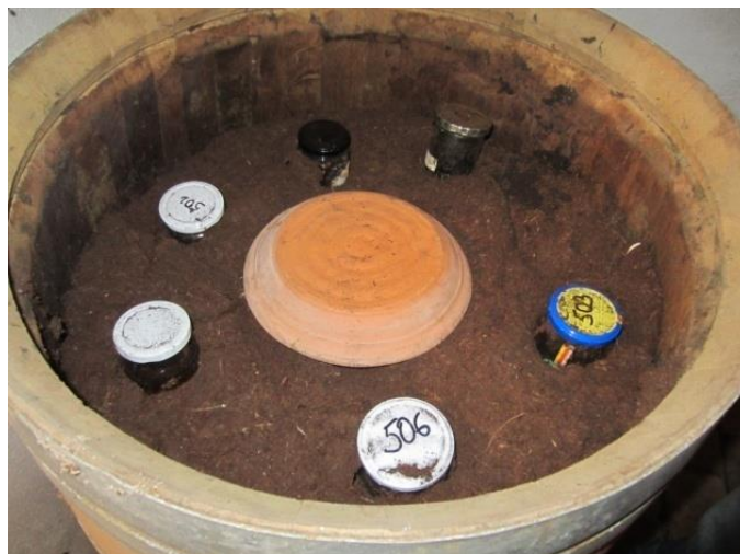
Slika 2.3.1.5 Način skladištenja biodinamičkih pripravaka