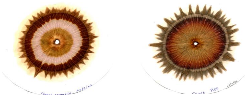
Slika 2.3.8.b Osjetljiva kristalizacija uzorka mrkve (lijevo iz konvencionalnog uzgoja, desno biodinamička)

Slika 2.3.8.b prikazuje osjetljivu kristalizaciju konvencionalno i biodinamički uzgojene mrkve. Vidi se kako kristalizacijski uzorak biodinamički uzgojene mrkve nema oštih promjena boje naspram uzorka konvencionalno uzgojene mrkve.