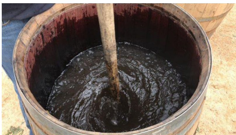
Slika 2.3.2.a Dinamiziranje biodinamičkih pripravaka

Dinamiziranje biodinamičkih pripravaka je postupak njihovog razrjeđivanja s vodom i intenzivnog miješanja. Svrha miješanja jest stvoriti efekt vira kojim se u sredini posude dobiva vertikalni krater, odnosno, vrtlog. Jednom ili dva puta u minuti mijenja se smjer miješanja kako bi se vrtlog slomio i stvorio novi (Waldin, 2016). Slika 2.3.2.a prikazuje način dinamiziranja. Masson (2011) spominje kako bi stvoreni vir trebao biti što ravniji i dublji, odnosno, trebao bi se protezati do dna posude.