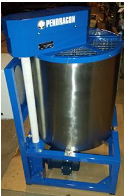
Slika 2.3.2.b Mehanički dinamizator pripravaka

Kod miješanja većih količina vode, naporan posao moguće je olakšati tako da se za neki čvrsti oslonac iznad posude za miješanje učvrsti dugački štap. Vrh štapa pri tom je labavo učvršćen, a završetak na koji se stave grančice u obliku metle slobodno se kreće u posudi (Znaor, 1996). Dodavanje nepromiješane tekućine u onu koja je promiješana poništava učinak dinamiziranja. Dinamizirane tekućine treba aplicirati prskanjem čim se završi s miješanjem, ili ubrzo nakon miješanja. Sprejevi za tlo nanose se na tlo u obliku velikih kapi uz pomoć četke, a čajevi za biljke i pripravak 501 nanose se prskalicom u obliku sitne maglice (Waldin, 2016). U današnje vrijeme postoje strojne mješalice namijenjene za dinamiziranje većih količina biodinamičkih pripravaka (slika 2.3.2.b).