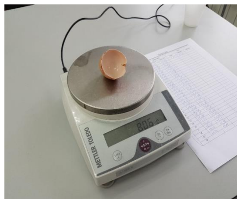
Slika 4.5.1.3. Određivanje mase ljuske jajeta