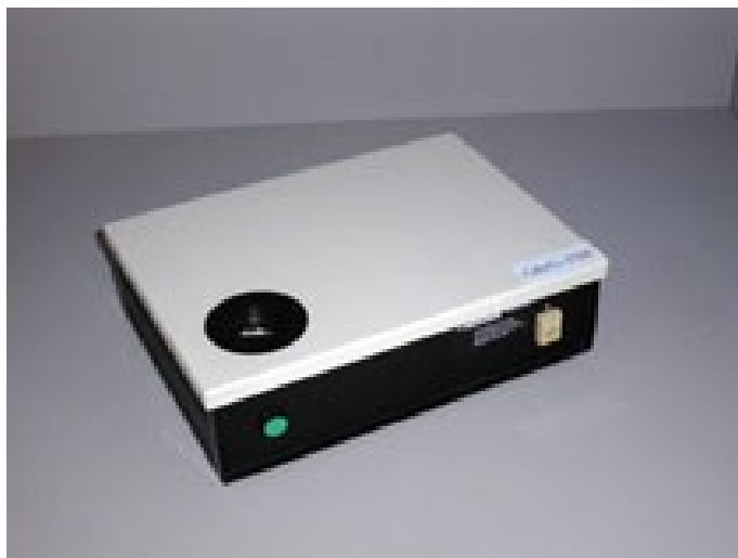
Slika 2. Kolorimetar

Boja svakog ploda je mjerena na najtamnijem te na najzelenijem mjestu ploda. Boja je mjerena pomoću kolorimetra ColorTec-PCM Plus 30mm Benchtop Colorimeter (ColorTec Associates, Inc. Clinton, New Jersey, SAD) (Slika 2.) prema CIE LAB sistemu (CIE, 2008.).