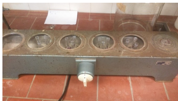
Slika 7. Zagrijavanje uzoraka u vodenoj kupelji