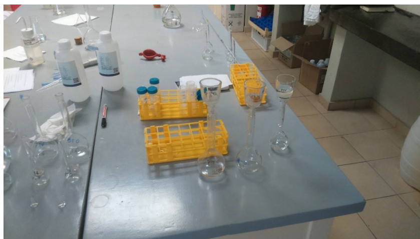
Slika 10. Filtriranje kroz sintrovane ljevčiče