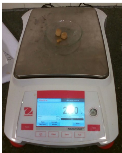
Slika 6.. Digitalna vaga s 2g uzorka

Uzorci za analize pektina su pripremljeni tako da je dva grama mesa ploda (Slika 6.) homogenizirano s 12 ml destilirano vode i 40 ml 96% etanola te je zatim deset minuta grijano u vodenoj kupelji (Slika 7.) na 80 °C uz povremeno miješanje. Tako homogenizirani uzorak se zatim stavlja u stroj za centrifugiranje (Eppendorf Centrifuge 5804R) na 10 minuta pri brzini od 5500 okretaja u minuti. Nakon centrifugiranja i dekantiranja, ostatak je ponovo estrahiran s 63% etanolom deset minuta na 80 °C. Takav ekstrakt se opet centrifugira 10 minuta pri brzini od 5500 okretaja u minuti. Nakon centrifugiranja i dekantiranja, ostatak se ispire pet puta s 63% etanolom , dok se uz pomoć otopina Carrezi I i Carrezi II nije utvrdilo da u ekstraktu više nema šećera.