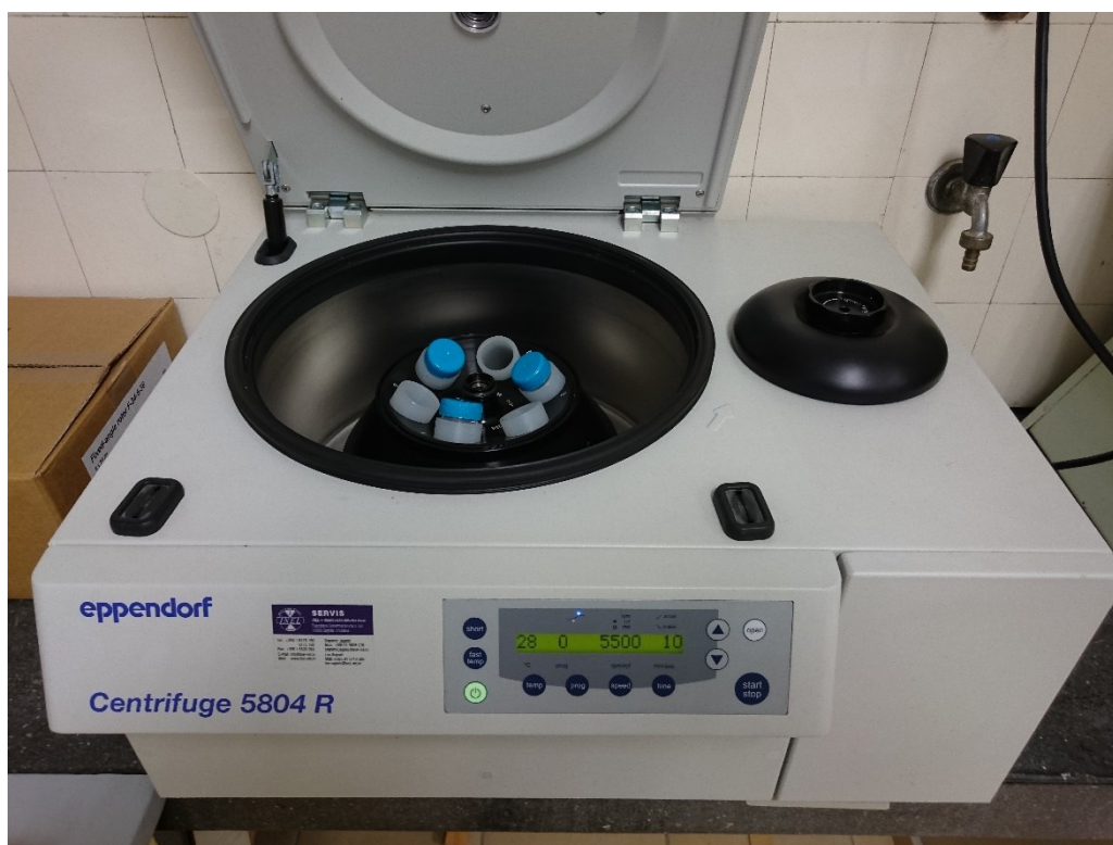
Slika 8. Centrifuga s unutarnjim hlađenjem

Za frakciju pektina topivih u amonijevom oksalatu ( (\text{NH}_4)_2\text{C}_2\text{O}_4 ), talog je preliven s 3 ml amonijevog oksalata te je miješan na magnetnoj miješalici. Zatim ide na centrifugu (Slika 8.) 10 minuta pri brzini od 5500 okretaja u minuti, nakon čega se ekstrakt prelije preko sintrovanog lijevka u odmjernu tikvicu od 50 ml, a postupak s talogom je ponovljen. Nakon što je talog dva puta ispran s amonijevim oksalatom i centrifugiran, u odmjernu tikvicu je dodano 5 ml 1M NaOH te nadopunjeno amonijevim oksalatom do oznake. Tako pripremljen ekstrakt je ostavljen 15 minuta prije daljnje pripreme za očitavanje na spektrofotometru.