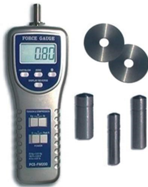
Slika 3. Digitalni penetrometar

Tvrdoća plodova određena je digitalnim penetrometrom PCE-PTR200 (PCE Deutschland GmbH, Meschede, Njemačka)(Slika 3.) sa skalom izraženom u \text{kg cm}^{-2} i sondom promjera 11 mm. Nožićem je na četiri mjesta na ekvatoru ploda (četiri nasuprotna mjesta, tj. u križ), odstranjena kožica. Na tim mjestima je sondom vršen pritisak na meso ploda do dubine od 10 mm (odnosno do ureza na klipu) te je vrijednost tvrdoće ploda očitana na zaslonu penetrometra.