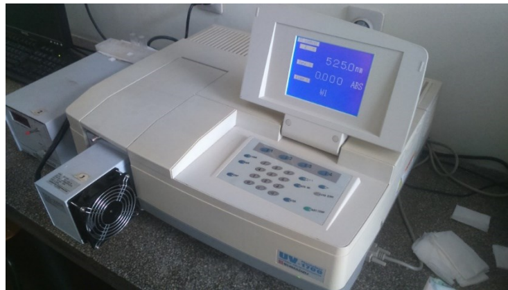
Slika 5. Spektrofotometar