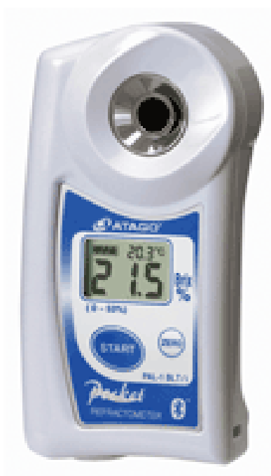
Slika 4. Digitalni refraktometar

Sadržaj topljive suhe tvari izmjeren je digitalnim refraktometrom Atago Pal-1 (Atago Co., LTD., Tokyo, Japan) (Slika 4.). Topljiva suha tvar mjerena refraktometrom je prividna i izražava se kao vrijednost šaroze te se stoga i naziva “prividnim šećerom” iako se u sastav topljive suhe tvari ubrajaju šećeri, organske kiseline, soli i aminokiseline (Voća i sur., 2011.). Postupak se temelji na fizikalnom zakonu loma svjetlosti, koji se događa na granici između dviju tvari različite gustoće. Granica se određuje odnosom brzine prolaza svjetlosti kroz zrak i tekućinu (sok breskve). Lom svjetla očitava se na ljestvici refraktometra od 0-30 %. Na prizmu refraktometra nanese se nekoliko kapi soka, te se pritiskom na gumb pokrene mjerenje. Rezultat je očitavan na zaslonu refraktometra.