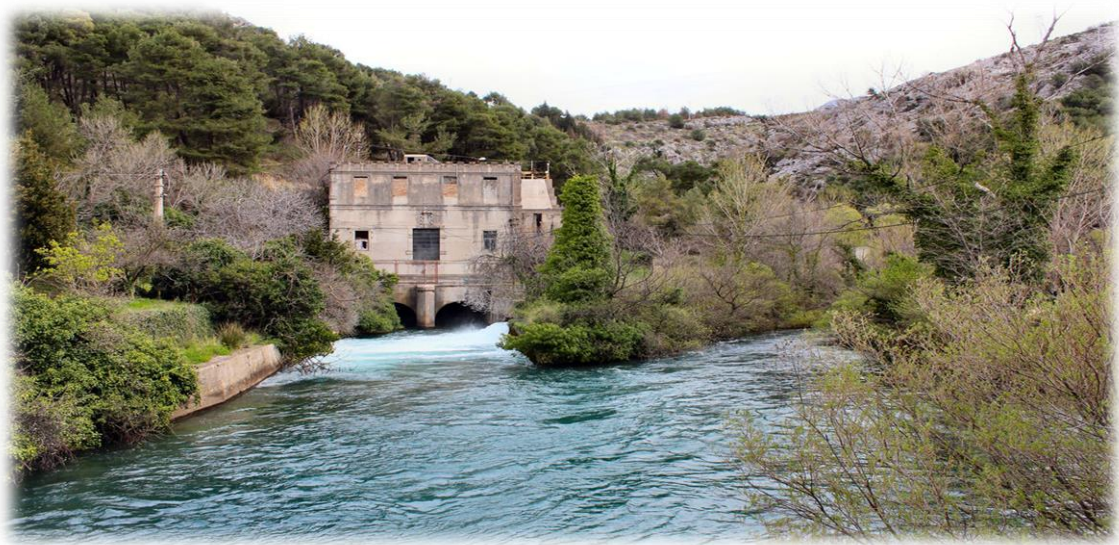
Slika 4.2.1. Rijeka Jadro izvor

Izvor rijeke Jadra koristio se još u antici za opskrbu vodom, putem akvadukta, rimske Salone i Dioklecijanove palače. Zbog njena značaja i događaja iz starohrvatske povijesti, naziva ju se i hrvatskim Jordanom. Na njoj se nalazi Gospin Otok na kojem je hrvatski povjesničar i arheolog don Frane Bulić (1846.-1934.) otkrio brojne nalaze iz starohrvatskog razdoblja, uključujući ulomke s epitafom na sarkofagu kraljice Jelene (976.), značajne za utvrđivanje kronologije srednjovjekovne hrvatske povijesti i rodoslovlje dinastije Trpimirovića ističe (Pavich, A. 2006). Odlukom Skupštine općine Split od 22.3.1984. godine gornji tok rijeke Jadro zaštićen je u kategoriji posebni ihtiološki rezervat. Površina rezervata je oko 7,8 ha, a obuhvaća vodotok i obalu rijeke Jadro od izvora do Uvodića mosta.