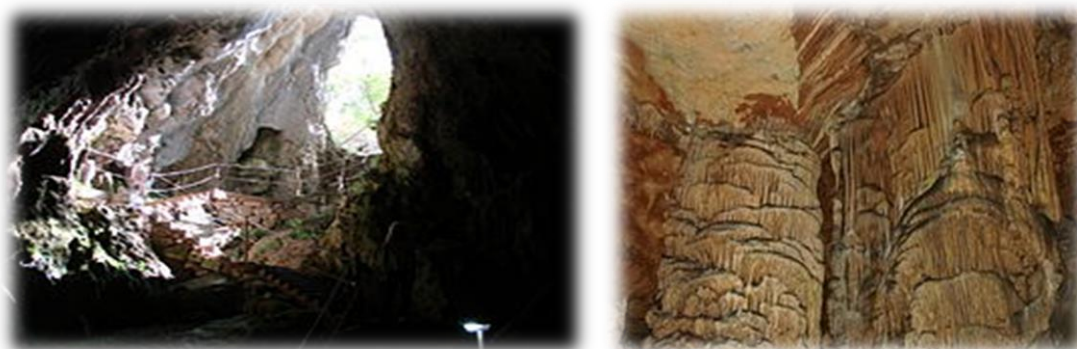
Slika 4.1. Špilja Vranjača

Špilja Vranjača ; špilja smještena u podnožju središnjeg dijela planine Mosor, s njene sjeverne strane, kod sela Kotlenice, na području Dugopolja, kraj Splita. Pristup špilji je moguć iz smjera Dugopolja, a do špilje vodi 300 metara duga makadamska cesta koja se u Kotlenicama, u zaseoku Punde, odvaja od glavne ceste kroz Kotlenice. Ulazna dvorana špilje je bila poznata mještanima Dugopolja još u 19. stoljeću. Drugu dvoranu je 1903. otkrio Stipe Punda, vlasnik zemljišta na kojem se špilja nalazi. Profesor Umberto Girometta zaslužan je za propagiranje ljepota špilje, zbog kojih je otvorena za posjetitelje 1929. godine. Špilja s sastoji od dvije dvorane. Ulazna dvorana nema sigu, a iz nje se kroz mali prirodni hodnik ulazi u drugu dvoranu, prepunu sigastih ukrasa raznih oblika i boja. Druga dvorana obiluje stalaktitima i stalagmitima. Ukupna dužina špiljskih kanala iznosi oko 360 metara objašnjava (Pešić N. 2006. ). Temperatura unutar špilje identična je u svako doba godine i iznosi 15°C. Špilja ima uređene stepenice, konope postavljene duž stepenica i staze za posjetitelje, postavljenu rasvjetu, vrata i nadzornu službu.