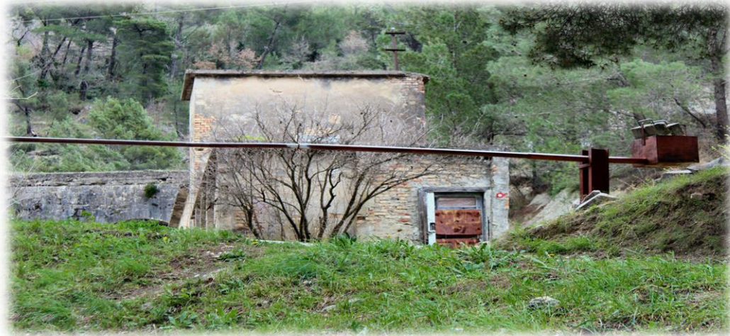
Slika 4.3.1. Planinarska markacija kod izvora Jadra, na početku staze za Debelo brdo