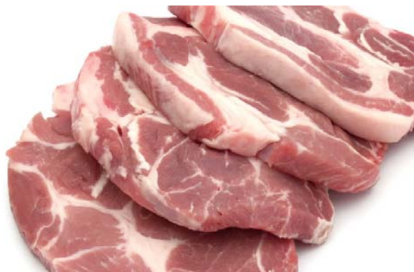
Slika 2.4.2. Svinjsko meso