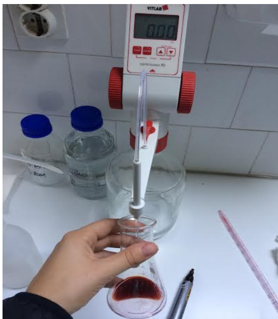
Slika 5. Metoda direktne titracije