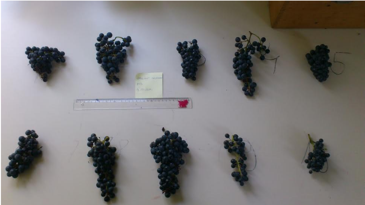
Slika 4. Mjerenje grozdova za uvometrijsku analizu grozda i bobice

Uvometrijska istraživanja se provode u fazi pune zrelosti grožđa. Uzorak ne smije biti manji od 10 grozdova i 100 bobica. Grozdovi moraju biti neoštećeni i uzimaju se na točno propisan način koji osigurava reprezentativnost uzorka.