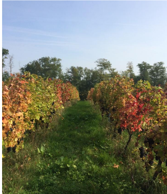
Slika 3. Mikorizirani redovi, Jazbina 2014.