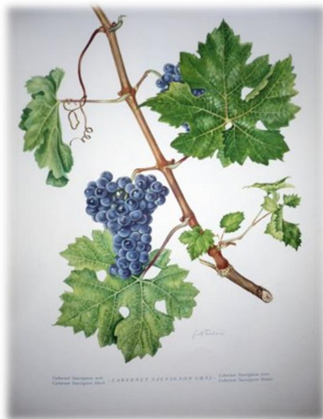
Slika 2. Cabernet sauvignon crni.

Sorta nema posebne zahtjeve prema tlu. U pravilu mu odgovaraju viši brežuljkasti položaji koji nisu izloženi smrzavicama. Dobro podnosi sušna a tako i kišna razdoblja u jesen, ako ne traju predugo. Dozrijeva potkraj drugog razdoblja.