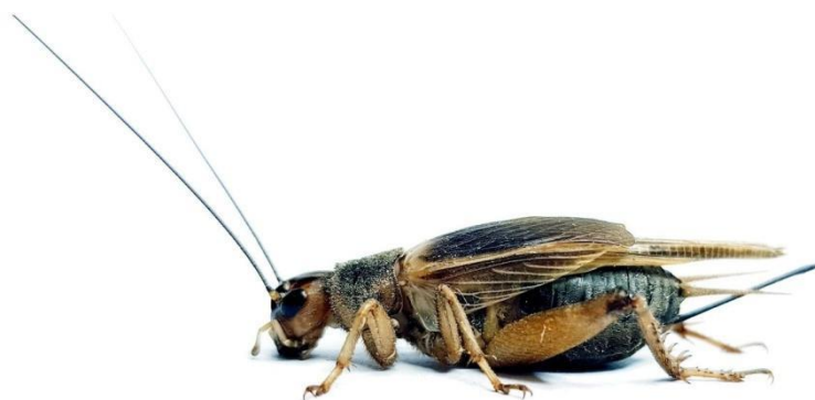
Slika 3.: Jamajčanski poljski šturak Gryllus assimilis .

Gryllus assimilis Fab. pripada u razred Insecta , red Orthoptera , podred Ensifera , porodicu Gryllidae i rod Gryllus . Obilježja vrste su svjetlija boja od drugih vrsta šturaka, područje oko očiju koje je svjetlo žuto-smeđe boje i pronotumobrašten gustim dlačicama smeđe boje (Slika 3.). Prvi put je opisan na Jamajci i široko je rasprostranjen po zapadnoj Indiji. Sve razvojne faze ove vrste mogu se simultano pojaviti tijekom godine. Prirodno stanište su mu livade, zakorovljena polja i ostala otvorena zatravljena područja. Ponekad leti u rojevima (Walker, 1969).