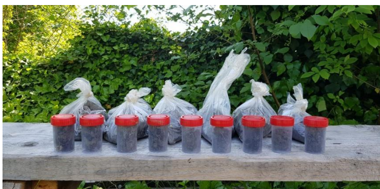
Slika 7.: Uzorci tla pripremljeni za analize nakon berbe salata.

Tijekom pokusa uzeti su uzorci tla sa svih parcela kako bi se poslali na mikrobiološku analizu u Institut Ruđer Bošković (tablica 6.).