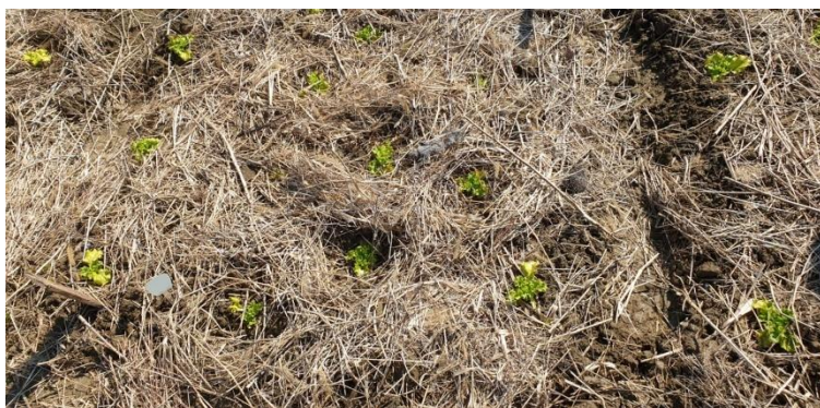
Slika 11. Malčirane presadnice

Prosjeck vegetacije, od sadnje presadnica do berbe, ove sorte je 40-50 dana i svojstvo sorte je iznimno dugo razdoblje do izduljivanja i prelaska u generativnu fazu (cvatnje i stvaranje sjemena) (Sakata 2021). To svojstvo je dopustilo produženi boravak salata na polju kako bi se postigli komercijalni prinosi, no nakon 60 dana primijećeno je izduživanje te se nije uspjela postići veličina rozete kakva je svojstvena za ovu sortu. Berba je provedena 63 dana nakon sadnje, odnosno, 1.6.2021. godine (Slika 12.). Berba se obavila ručno. Zbog uvijeta tokom trajanja pokusa pojedini tretmani su pretrpjeli gubitke i minimalni broj je bio 12 jedinki salate unutar tretmana.