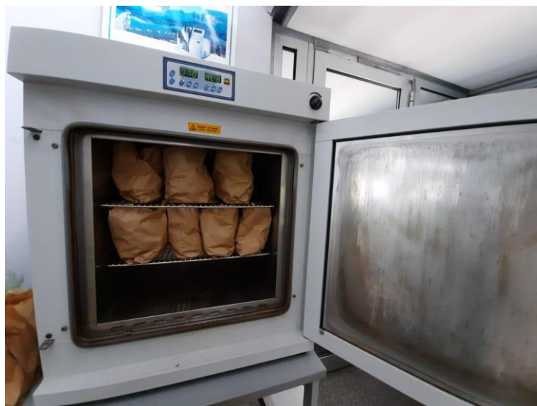
Slika 13. Sušenje uzoraka salate u sušioniku.