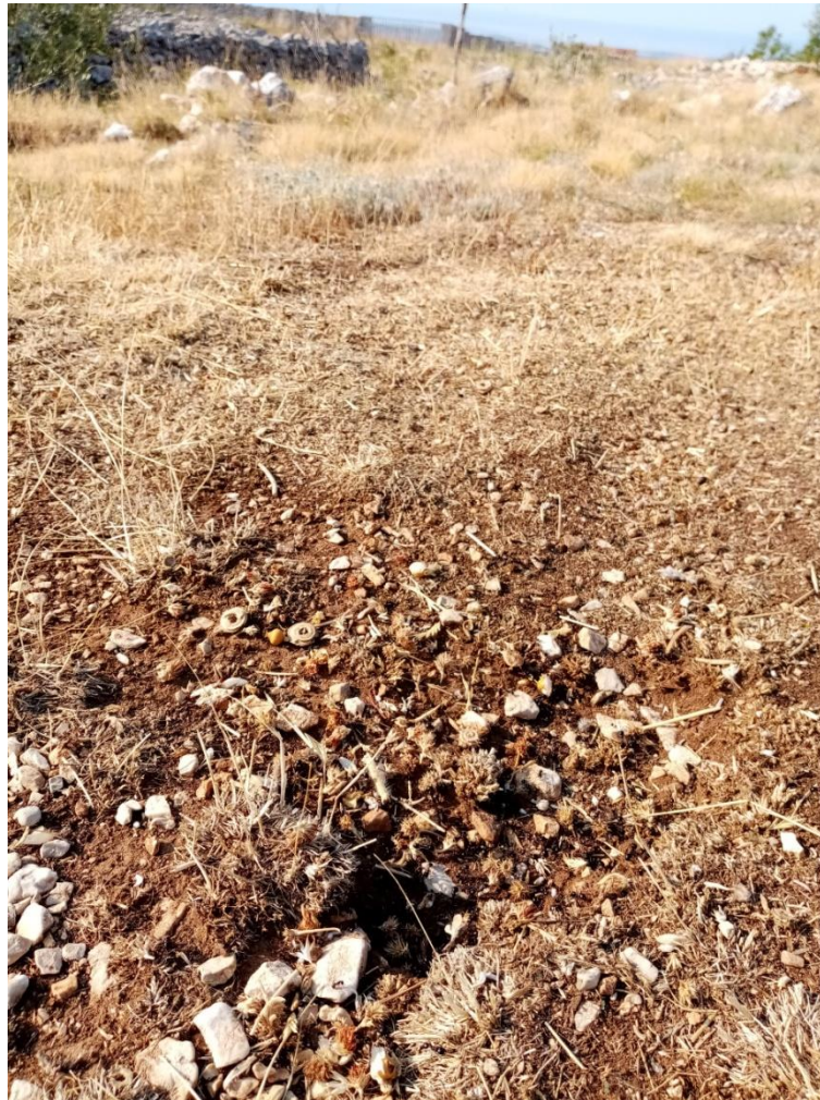
Slika 1. Mravi premještaju i usitnjavaju organski materijal oko svog staništa.

depozicije fekalija i dekompozicije tijela insekata (Behie i Bidochka, 2013). Osim dušika, značajan izvor kalcija u tlu čine upravo mrtvi ostaci člankonožaca (Culliney, 2013).