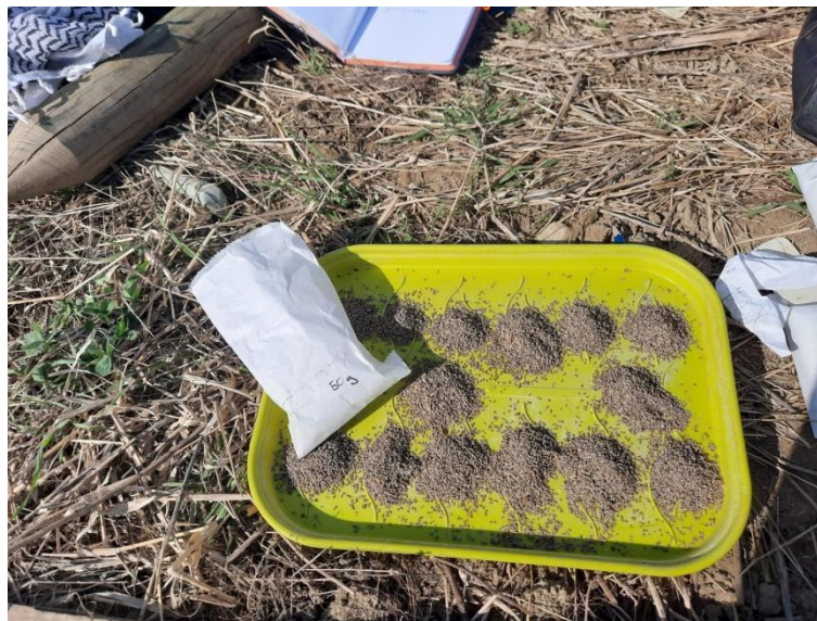
Slika 5.: Doziranje šturkovog izmeta za gnojidbu.

Šturkov izmet zajedno s drugim ostacima uzgoja šturka ustupio je "Insektarij - Tvornica buba" (Slika 5.).