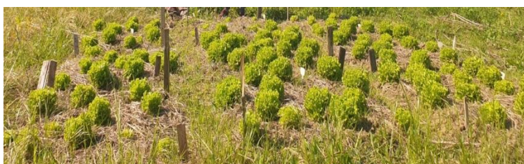
Slika 12.:Salate na polju prije berbe.

Prosjeck vegetacije, od sadnje presadnica do berbe, ove sorte je 40-50 dana i svojstvo sorte je iznimno dugo razdoblje do izduljivanja i prelaska u generativnu fazu (cvatnje i stvaranje sjemena) (Sakata 2021). To svojstvo je dopustilo produženi boravak salata na polju kako bi se postigli komercijalni prinosi, no nakon 60 dana primijećeno je izduživanje te se nije uspjela postići veličina rozete kakva je svojstvena za ovu sortu. Berba je provedena 63 dana nakon sadnje, odnosno, 1.6.2021. godine (Slika 12.). Berba se obavila ručno. Zbog uvijeta tokom trajanja pokusa pojedini tretmani su pretrpjeli gubitke i minimalni broj je bio 12 jedinki salate unutar tretmana.