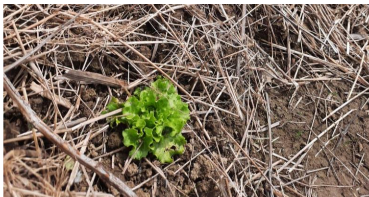
Slika 15.: Šteta na salati koju su uzrokovali puževi.

Na varijabilnost među tretmanima moguće je utjecala kompeticija s travom oko pokusnog polja. Pozicija unutar polja je mogla imati i utjecaja na izloženost nametnicima i štetočinama.