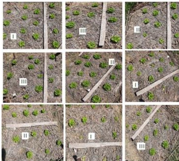
Slika 10.: Stanje salata na polju 11.5.2021.

Na polju su se nalazili razni štetnici, najviše puževi. Njih se tijekom vegetacije otklonilo i postavljene su mehaničke barijere koje su djelomično rješavale taj problem.