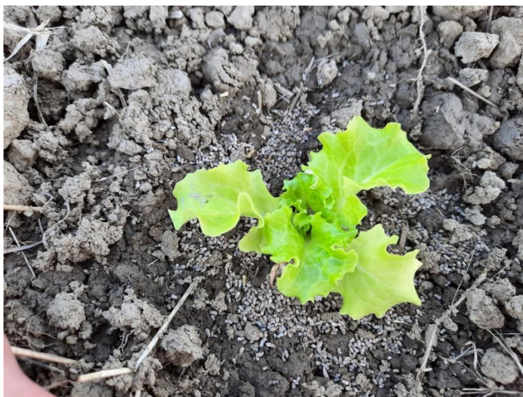
Slika 6.: Gnojidba šturkovim izmetom