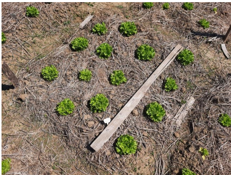
Slika 14.: Salata na pokusnom polju, tretman sII, ponavljanje 2.

Statistički značajna razlika je utvrđena u sadržaju sumpora i vodika među tretmanima. Tretman sIII (sterilizirani šturkov izmet) imao je značajno manju količinu supora i veću količinu vodika od ostalih tretmana.