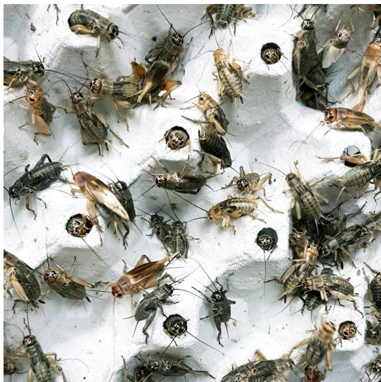
Slika 2. Uzgoj šturaka na kartonu.

Proizvodnja insekata u Europskoj uniji je većinom u malim skalama (Zahn, 2017). To stvara ekonomske probleme u isplativoj primjeni insekata u industriji i prehrani te je potrebno povećanje skale proizvodnje kako bi uloženi trud u razvoj industrije polučio pozitivne rezultate (Arru i sur., 2019). S tim problemom se suočava industrija insekata u cijelom zapadnom svijetu. Predviđa se porast vrijednosti ove industrije što uključuje rješavanje problema malih skala proizvodnje. Uzgoj insekata nije tehnološki niti kapitalno zahtjevan pothvat (Zahn, 2017).