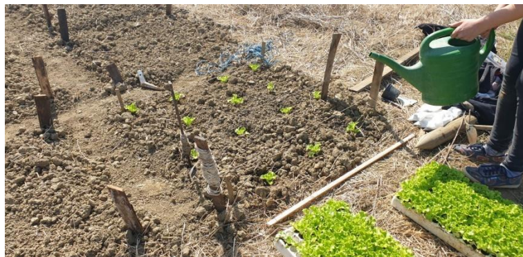
Slika 8.: Sadnja sadnica na pokusno polje.

Presadnice su posađene 29.3.2021. (Slika 8.) na razmak redova 30 cm i razmak unutar reda 30 cm na pokušalištu Maksimir Zavoda za povrćarstvo, u studentskim vrtovima. Uzgojna površina organizirana je u latinski kvadrat s tri tretmana. Svaka varijanta zauzimala je površinu od 1 m 2 te je ukupna površina bila 9 m 2 . Pojedinačni tretman je uključivao 14 zasebnih jedinki salate. Uzorci su se analizirali u Analitičkom laboratoriju Zavoda za opću proizvodnju bilja, Agronomskog fakulteta u Zagrebu. Mikrobiološka analiza napravljena je na Institutu Ruđer Bošković u suradnji s Veterinarskim fakultetom Sveučilišta u Zagrebu.