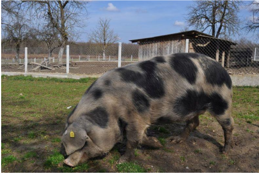
Slika 2.1. Banijska šara svinja

uzgaja na području Sisačko-moslavačke, Bjelovarsko-bilogorske, Zagrebačke, Zadarske, Požeško-slavonske i Vukovarsko-srijemske županije (HAPIH 2022.).