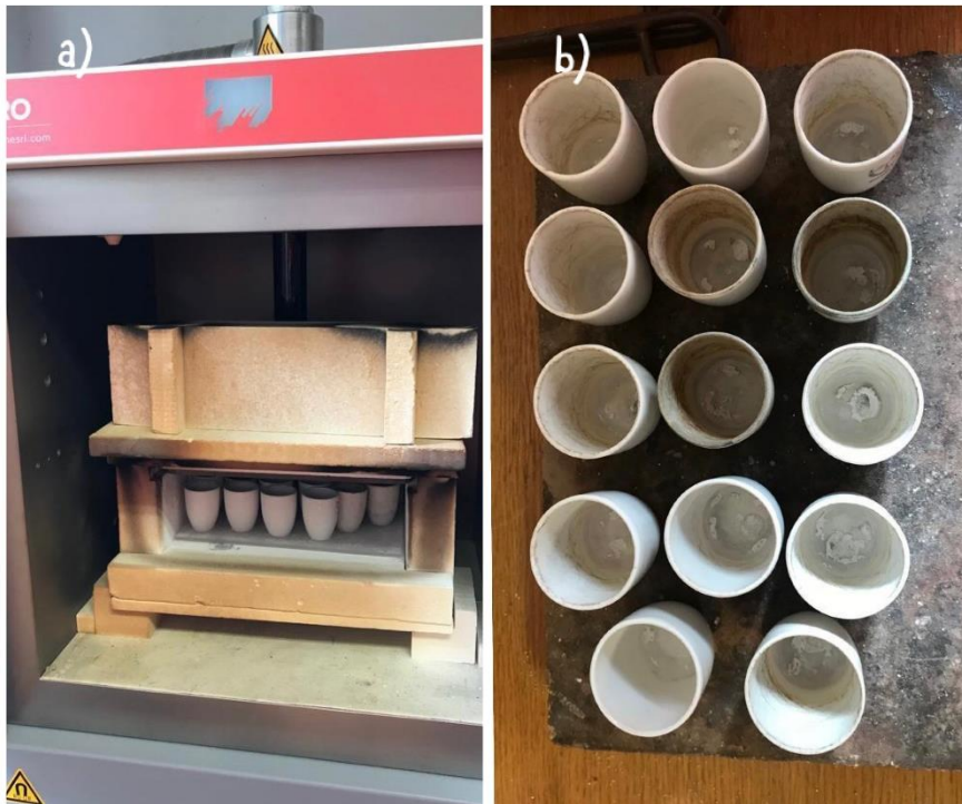
Slika 3.1.5. Analiza NDV s prikazom lončića nakon spaljivanja u mikrovalnoj peći (a) mikrovalna peć s lončićima i kapsulama prije spaljivanja (b)