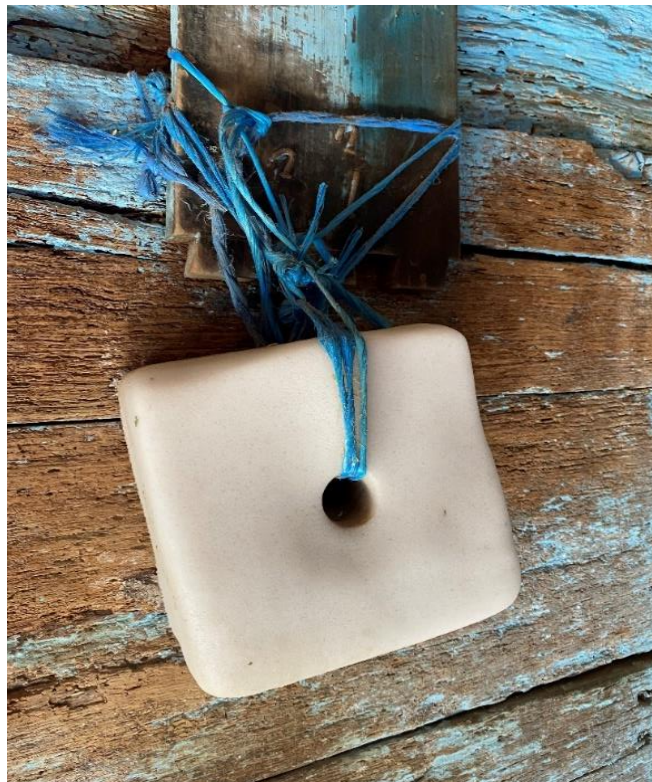
Slika 2.8.1. Mineralni kamen za lizanje

dehidracije životinje. Također, pri intenzivnom radu izlučuju se veće količine želučane kiseline, pada pH, što često dovodi do čira na želudcu, stoga je bitno konje u intenzivnom radu i u stresnim uvjetima izvoditi na pašu. Prije izlaganja radu preporučuje se hranidba pašom u malim količinama. Ukoliko je hranidba bazirana samo na žitaricama smanjuje se dostupnost slobodnih masnih kiselina i povećava unos glukoze u radni mišić, što nije poželjno tijekom dugotrajnog izlaganja radu. S druge strane, sijeno zajedno sa žitaricama dovodi do smanjenja volumena plazme i povećanja tjelesne mase što može loše utjecati na sveukupne performanse konja. U stresnim uvjetima i u radu povećava se i znojenje. Znojenjem organizam gubi važne elektrolite kao što su natrij, kalij i klor, što dovodi do umora i slabosti mišića. Prema Pagan (2005.) konji pri umjerenom radu gube između 5 i 10 L znoja, a time i do 50 g/dan natrija, 83 g/dan klora te 52 g/dan kalija. Gubitci se podmiruju dodatkom soli (Slika 2.8.1.) te je za konje u umjerenom radu potrebno između 60 – 120 g soli/dan.