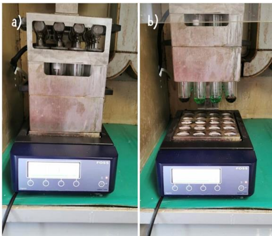
Slika 3.1.3. Spaljivanje uzorka na bloku (a) razgrađeni uzorci prije destilacije (b)

Vrijednost probavljivih bjelančevina (DB) izračunata je na temelju rada Šerman i Mikulec (1995.) za izračun probavljivih bjelančevina za trave i sijena: