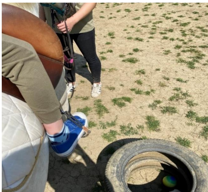
Slika 2.1.1. Izvođenje terapijskog jahanja na ranču „Don Kihot“

Korištenje konja u terapijske svrhe ili terapijsko jahanje podijeljeno je na hipoterapiju, pedagoško jahanje, ergoterapiju, psihoterapiju pomoću konja i sportsko jahanje za osobe s invaliditetom. Različite programe provode specifični profili stručnjaka, stoga hipoterapiju provode licencirani fizioterapeuti, pedagoško jahanje rehabilitatori te stručnjaci sličnog profila, ergoterapiju radni terapeuti, a psihoterapiju pomoću konja psiholozi (Drempetić 2013.). Terapijsko jahanje u svijetu se prepoznaje pod nazivima terapija pomoću konja (Equine Assisted Therapy) i terapija uz konja (Equine Facilitated Therapy). Često dolazi do miješanja pojmova hipoterapije i terapijskog jahanja, stoga je važno objasniti u čemu se razlikuju. Cilj terapijskog jahanja je opuštanje mišića, jačanje slabijih mišića, vježbanje koordinacije, održavanje ravnoteže kao i kroz razne igre poticanje motoričke i kognitivne vještine kod klijenata (Slika 2.1.1.) (Kendall i sur. 2013.).