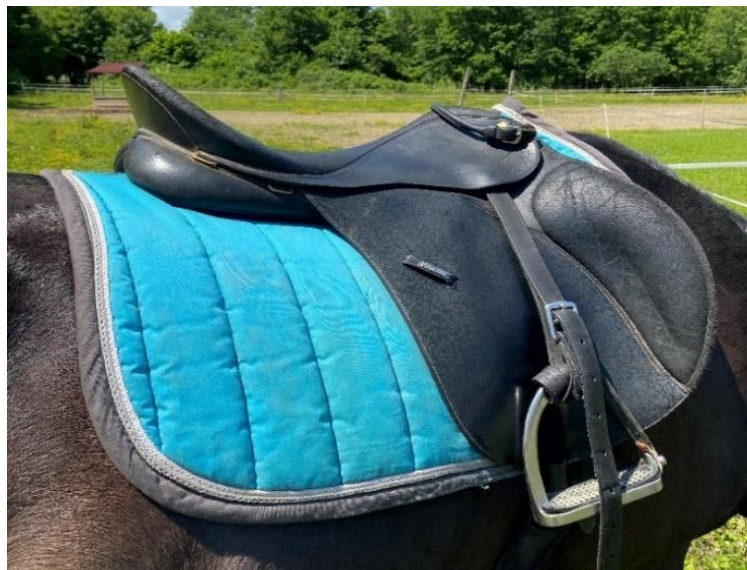
Slika 2.1.2. Englesko sedlo za terapijsko jahanje

Od sigurnosne opreme obavezna je kaciga, sigurnosni stremeni i ručka za koju se jahač pridržava. Stremeni osiguravaju pravilan položaj stopala tijekom jahanja, dok dodatna površina služi za prijenos težine pa se na taj način povećavaju kretnje u zglobu gležnja. U terapijskom jahanju mogu se koristiti svi tipovi sedala, no najčešće se koriste tri različita tipa engleskog sedla: preponaško, dresurno i višenamjensko. Međutim, pri korištenju opreme nema strogih pravila te se ona prilagođava svakom jahaču (Slika 2.1.2.) (Krpmotić 2003.).