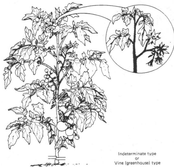
Indeterminate type or Vine (greenhouse) type