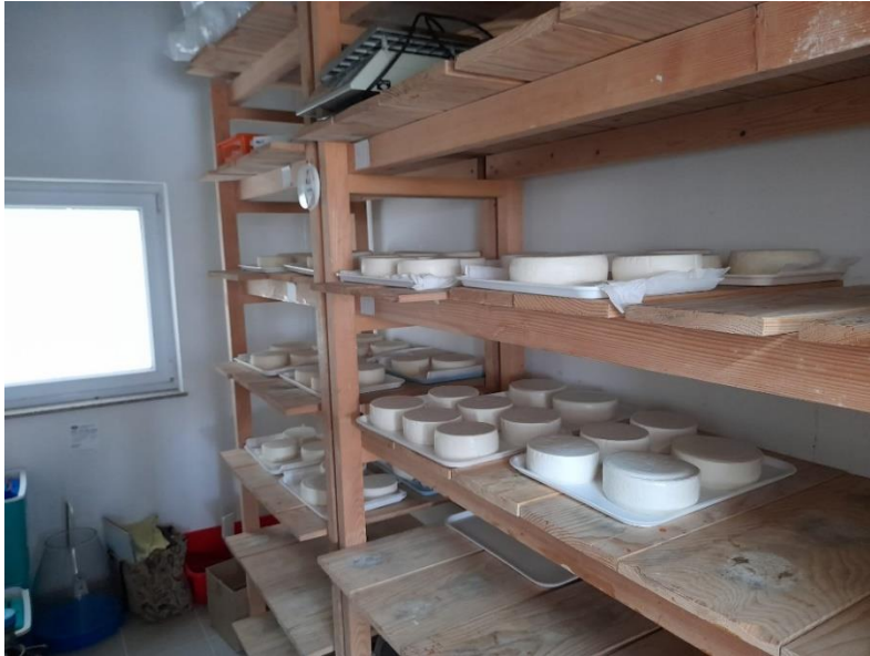
Slika 3.1.12. Zrenje sira na zraku (policama)

Zrenje sira prve grupe sireva, uz njegu sira, trajalo je 60 dana na polici (Slika 3.1.12.), dok se druga skupina nakon 10 dana zrenja na polici položila u mješavinu mljetskog maslinovog i komercijalnog suncokretovog ulja (50:50), te je zrenje u ulju trajalo 50 dana (3.1.13.). Temperatura u zrioni iznosila je 15-17°C, a relativna vlaga zraka 70-80%.