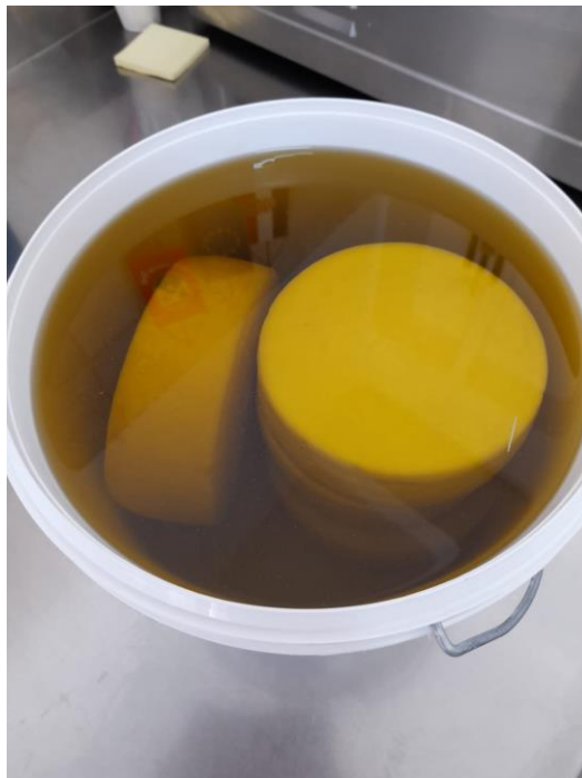
Slika 3.1.13. Zrenje sira u ulju