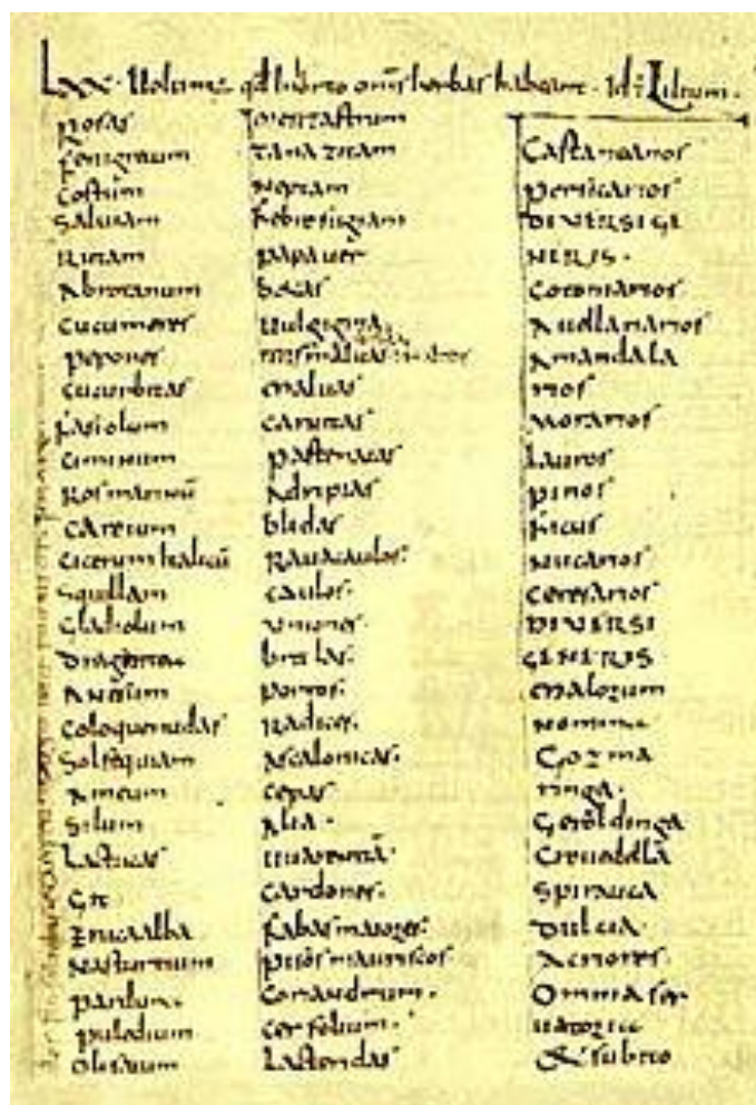
Slika 3.1. Poglavlje iz djela Karla Velikog - Capitulare de villis vel curtis imperii

Karlo Veliki (742. – 814.) je u svom djelu „ Capitulare de villis “ opisao upute za uzgoj ljekovitog bilja i time potaknuo njegovu primjenu (Slika 3.1.). Također, benediktinci su tijekom 6. stoljeća počeli uzgajati ljekovito bilje (Kolak i sur., 1997.). U susjednoj Bosni i Hercegovini franjevci su koristili biljke za liječenje već od 13. stoljeća, a takva praksa se održala sve do početka 20. stoljeća. Franjevci su se služili raznim knjigama, kodeksima i nabavljali lijekove iz Italije i Dubrovačke Republike (Mandić i Tomić, 2020.).