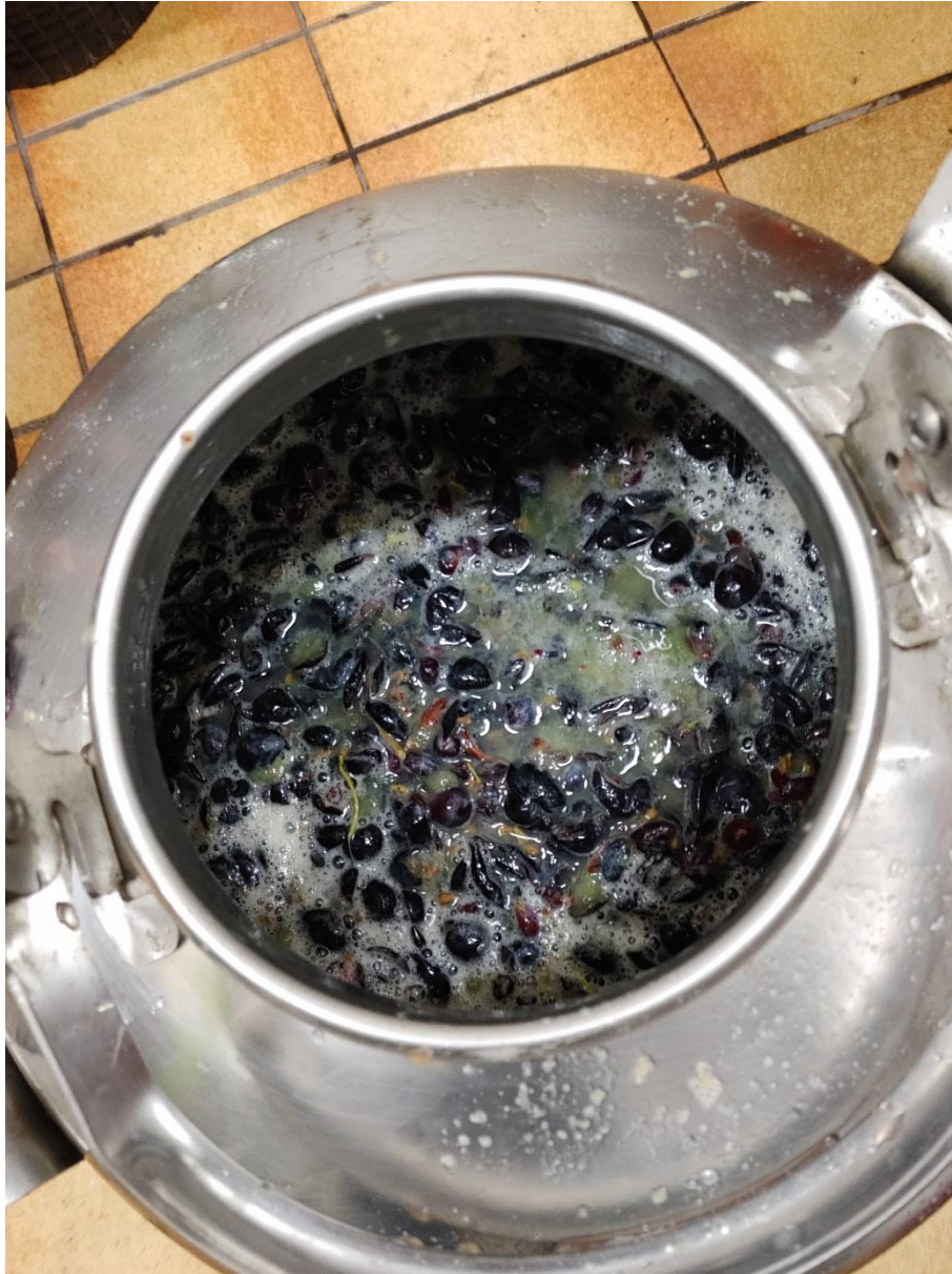
Slika 6. Prikaz masulja sorte 'Muškát Hamburg'