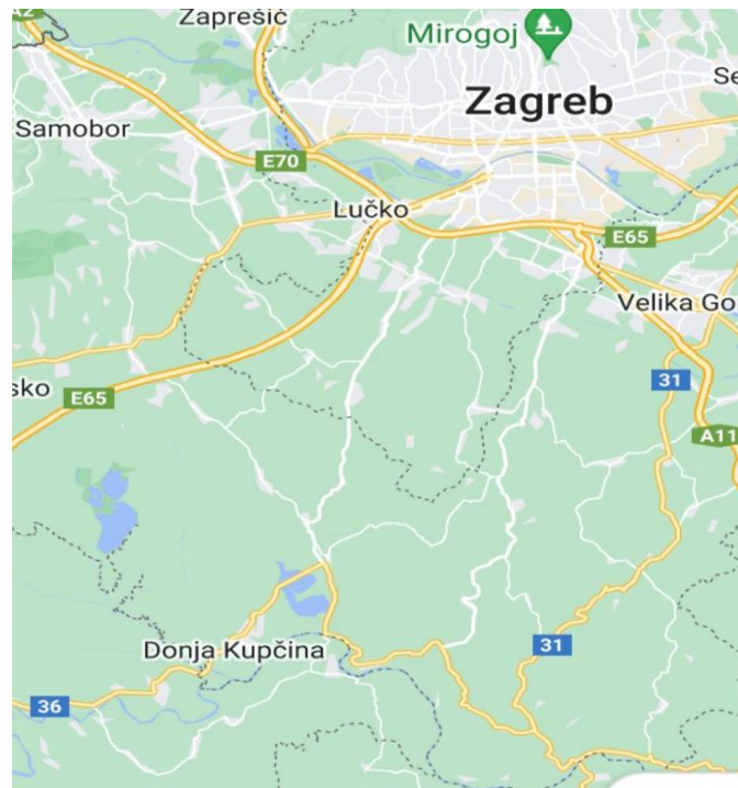
Slika 5.1. Prikaz lokacije na karti

Obiteljsko gospodarstvo Harambašić smješteno je u Donjoj Kupčini unutar općine Pisarovine i Zagrebačke županije.