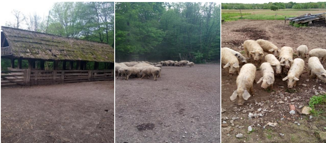
Slika 5. Nadstrešnice za svinje u gateru Lukavec i svinje na otvorenom

Prema Direktivi Europske komisije (Council Directive 98/58/EC) svaka obveza glede dobrobiti životinja mora uključivati poboljšanje standarda u sljedećim područjima: osoblje, inspekcije, vođenje evidencije, sloboda kretanja, objekti i smještaj, životinje koje se drže izvan objekta, automatska ili mehanička oprema, hrana, voda i ostale tvari, sakaćenja, postupci uzgoja.