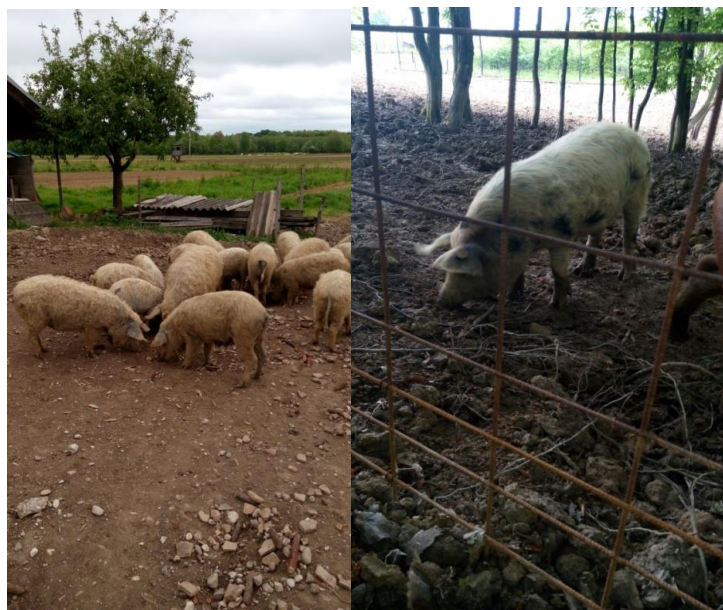
Slika 7. Rovanje svinja

Od parazitskih bolesti koje stalno ugrožavaju zdravlje svinja najpoznatiji su paraziti želuca ( Trichostrongylus axei ), crijeva ( Ascaus suum , Trichinella spiralis ), pluća ( Echinoccus granulosus ), jetra ( Fasciola hepatica ) te muskulature ( Trichinella spiralis ). Jedna od bolesti koja je se često javlja kod uzgajivača je trihinelozna izazvana parazitom Trichinella spiralis . Glavni gubitci koje uzrokuju paraziti su gubitak u prirastu, osjetljivost na razvoj drugih bolesti te napad bakterija (Salajpal i sur., 2013). Kako bi se parazitske bolesti stavile pod kontrolu moraju se često provoditi pretrage balege te tretiranja protiv parazita. Iz istraživanja koja su provedena na svinjama koje obitavaju na otvorenom pokazalo se da one imaju puno manje problema sa bolestima, odnosno njihovo zdravstveno stanje je bolje u odnosu na svinje držane u zatvorenim objektima (Fregonesi i Leaver, 2001).