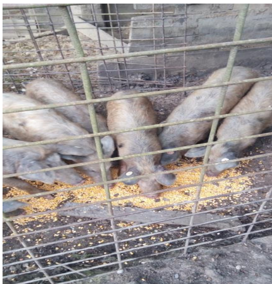
Slika 10. Hranidba turopoljske svinje kukuruzom

Krmače vole više vremena provoditi na otvorenom, pa im je zato i veći apetit vani, nego u zatvorenom prostoru. Krmačama u vrijeme laktacije osim voluminoznog krmiva poput silaže kukuruza, krumpira, stočne repe potreban je i koncentrat. Prasad treba dodatnu prihranu već nakon prvog tjedna života. Voda za piće treba im biti stalno dostupna i svježa. Osim što jedu biljke, rovanjem po tlu u organizam unose i crve, parazite i gliste. Na otvorenom se drže samo rasplodne životinje, dok one za tov se drže zatvorene u tovilištima (Senčić i Antunović, 2003).