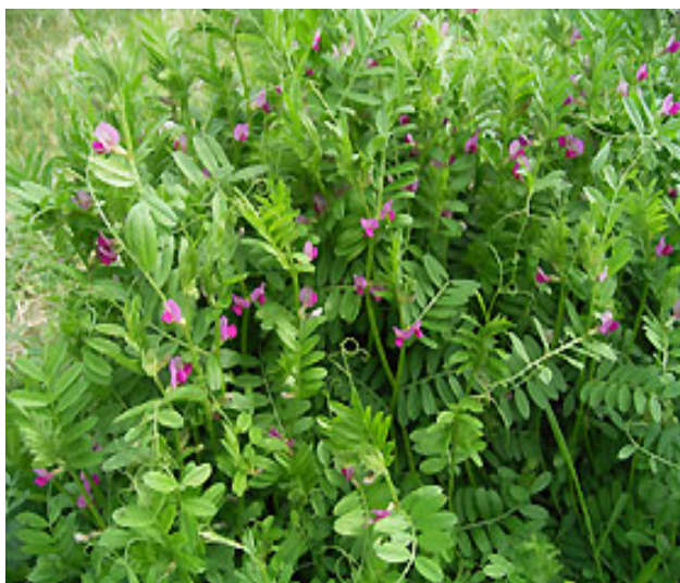
Slika 4.3.1.2. Jara grahorica cv. Ebena