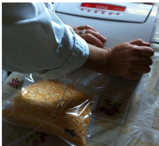
Slika 3. Vakumiranje uzoraka

Svi tretmani silirani su u vakum vrećice (Status, 280 × 360 mm, 25 set, Status d.o.o.) koje su vakumirane na uređaju za vakumiranje i varenje (SmartVac, Status d.o.o.; slika 3.).