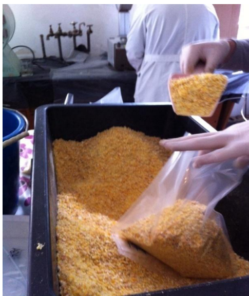
Slika 2. Samljeveni uzorci

Samljevena masa zrnja svake repeticije podijeljena je na tri jednaka dijela mase jednog kilograma: