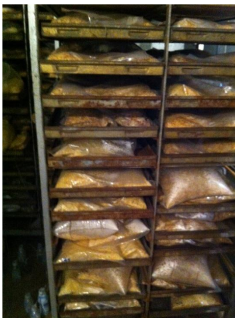
Slika 4. Čuvanje uzoraka

Vakumiranjem je inhibirana prva, aerobna, faza siliranja (Weinberg i Muck, 1996). Za svaki tretman pripremljeni su peteroplukati vakumiranih uzoraka silaža. Uzorci silaže silirani su 182 dana, tijekom siliranja su čuvane na sobnoj temperaturi (20 do 25 °C; slika 4.). Nakon uzorkovanja, svi uzorci su pospremljeni i čuvani na -20 °C do provođenja kemijskih analiza. Neposredno prije provođenja analiza, uzorci su prosušeni na 40 °C 24 sata, i samljeveni kroz sito 1 mm (Cyclotec, FossTecator, Švedska)