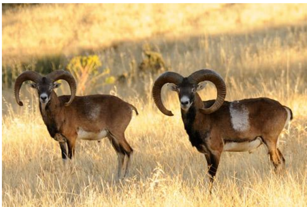
Slika 4.6.1. Mužjaci muflona

Budući da lovački trofej predstavlja najskuplji, ali i najatraktivniji derivat divlje životinje, razumljivo je kako su u većini europskih lovišta u kojima se gospodari muflonom provedena detaljna istraživanja o morfologiji rogova kako bi se selekcionirala što kvalitetnija trofejna grla (Krapinec i sur. 2006.), što daje mogućnost veće ponude trofejnih grla na lovno-turističkom tržištu.