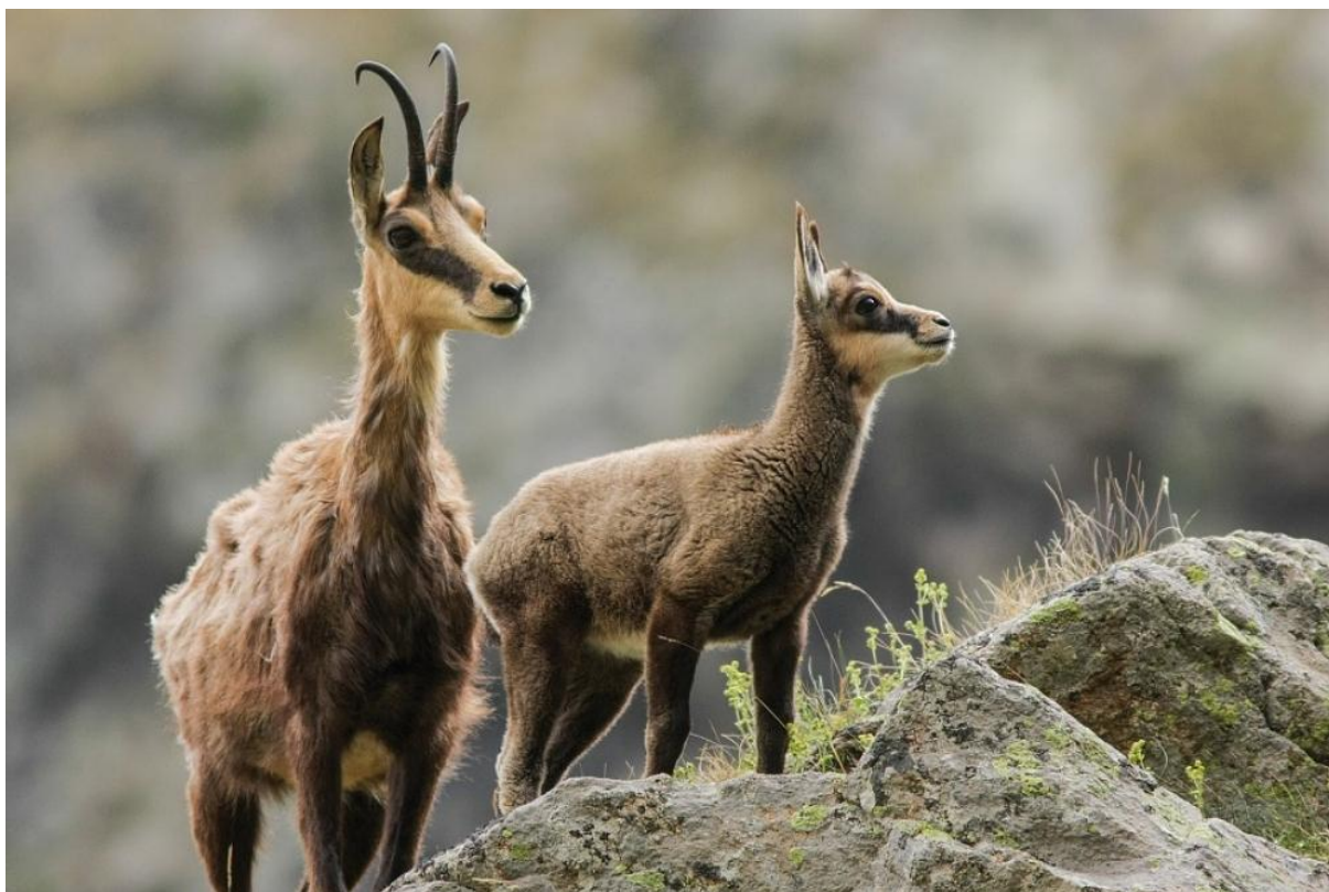
Slika 4.5.1. Ženka i jare divokoze