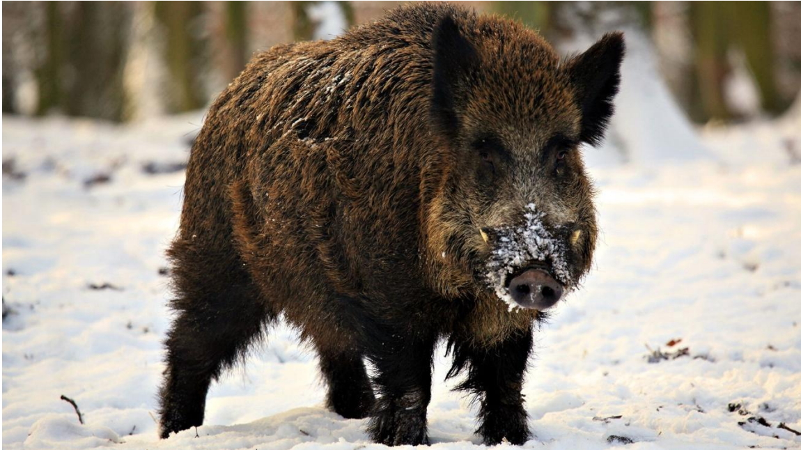
Slika 4.7.1. Mužjak svinje divlje