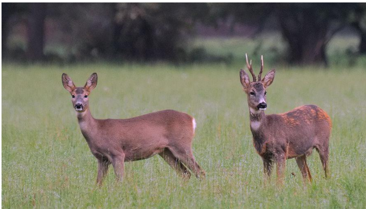
Slika 4.4.1. Ženka i mužjak srne obične