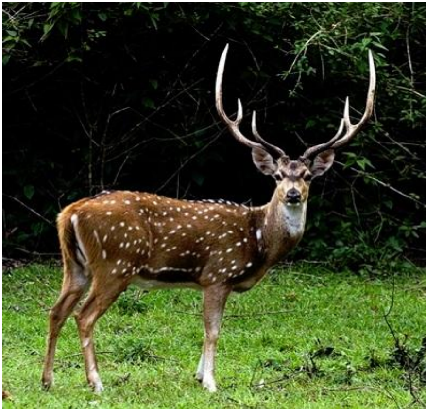
Slika 4.3.1. Mužjak jelena aksisa

Posljednji jelen iz porodice pravih jelena ( Plesiometacarpalia ) koji obitavaju na području Hrvatske je jelen aksis. Prvo pojavljivanje bilježi 1911. godine na Brijunima gdje je introducirano iz Njemačke (Šprem i sur. 2008.). Sa Brijuna se usporedo s velikom akcijom introdukcije ove tropske divljači u više kontinentalnih lovišta Hrvatske (Macelj, Posavlje, Zelendvor, Božjakovina, Zlatar, Sljeme) tijekom ožujka 1953. godine u organizaciji Šumskog gospodarstva "Viševica" Rijeka izvršio unos jelena aksisa na dvije lokacije otoka Cres. U mjesto Tramontana na sjeveru otoka (4 jelena i 8 košuta) i Punta Križa na zapadu (4 jelena i 7 košuta). Zatim na otok Plavnik (4 jelena i 6 košuta) i u Bribirsku šumu iznad Crikvenice (2 jelena i 7 košuta). Ukupno 14 jelena i 28 košuta (Frković 2014.).