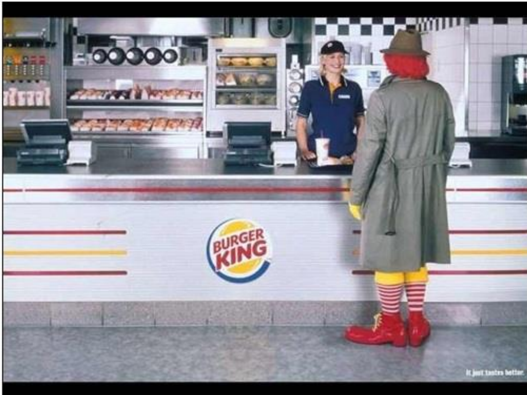
Slika 4.7 – Primjer usporednog oglašavanja kompanije Burger King

Na slici 4.7 nalazi se primjer usporednog oglašavanja kod kojeg dolazi do ocrnjivanja konkurenta i do nepoštenih prakse i koji kao takav u Republici Hrvatskoj ne bi bio dopušten. U desnom kutu oglasa stoji natpis koji glasi : „Jednostavno je okus bolji“. Burger King, kao lanac brze hrane, neizravno upućuje na svog konkurenta McDonalds tako što je prikazana maskota McDonaldsa kako čeka u redu za hranu u Burger Kingu. McDonaldsov klaun poznat je gotovo svima, pa se putem ovog oglasa zapravo umanjuje vrijednost McDonaldsovih proizvoda bez navođenja nikakvih konkretnih dokaza ili činjenica.