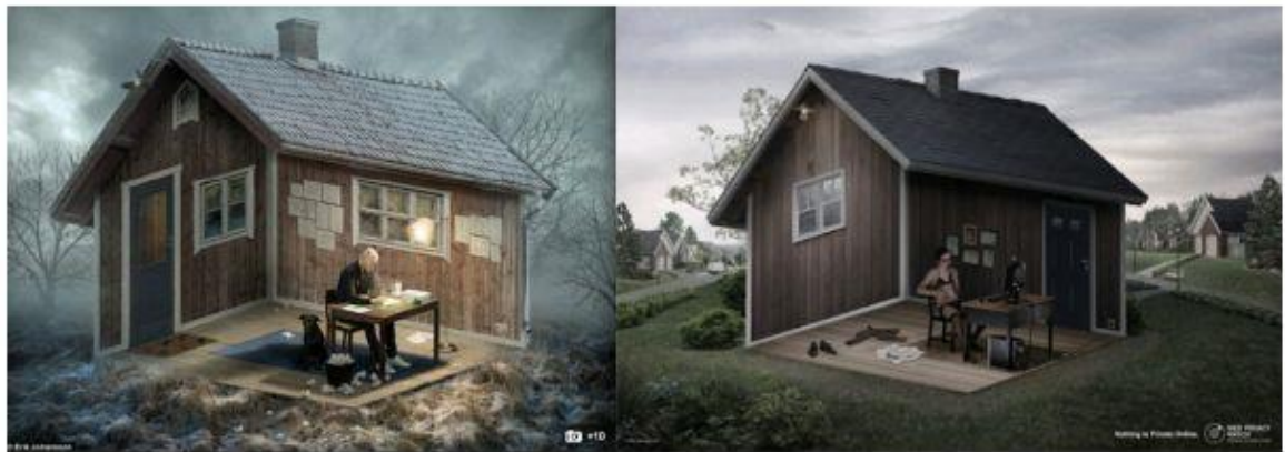
Slika 4.14 - primjer oponašanja tuđeg djela

vlasništva. Pod intelektualnim vlasništvom postoje dvije podgrupe prava, a to su autorsko pravo i industrijsko vlasništvo. Autorsko pravo podrazumijeva isključivo pravo autora na korištenje svojih tvorevina. 15 U industrijsko vlasništvo spadaju zaštitni znak ili žig, patenti, industrijski dizajn, oznaka zemljopisnog porijekla i izvornosti. Do povreda intelektualnog vlasništva dolazi kopiranjem ili plagiranjem te oponašanjem nečijeg djela, poput oponašanja komunikacije konkurencije, proizvodnja sličnih ambalaža i drugo.