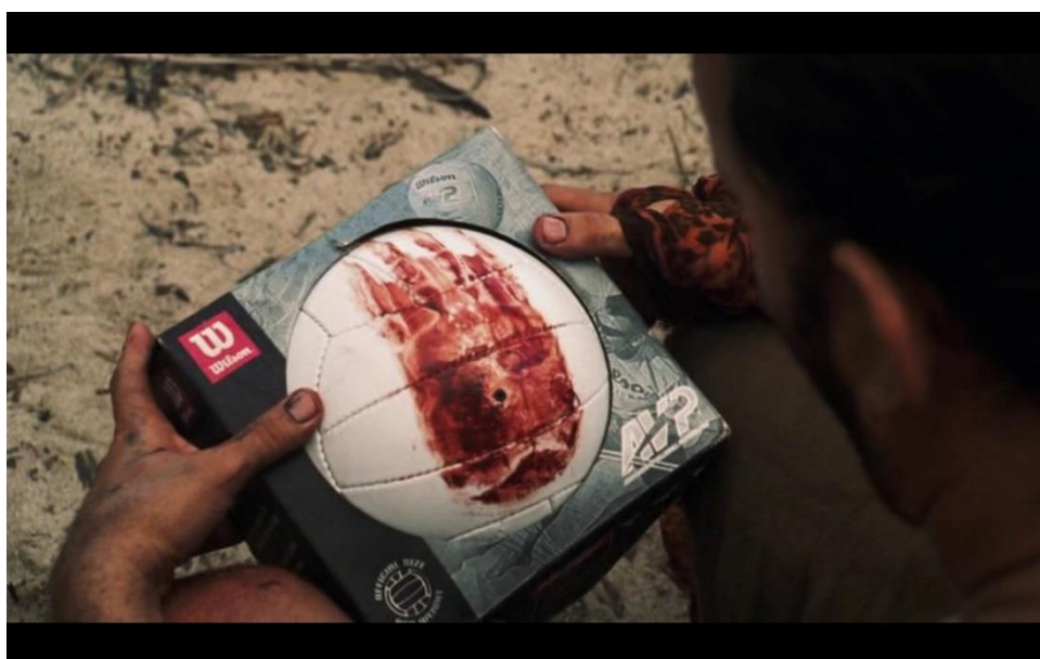
Slika 4.4 – Product placement robne marke Wilson u filmu Brodolom života

Elemente prikrivenog oglašavanja ima i takozvano prirodno oglašavanje ili native . Kod prirodnog oglašavanja oglas se prirodno integrira u neki medij. Na primjer, oglas je kreiran na isti način kao i članak na nekom portalu, a na taj način korisniku nije odmah jasno da se radi o oglasu. Također takav oglas nije agresivan, manje je nametljiv i tako privlači pažnju.