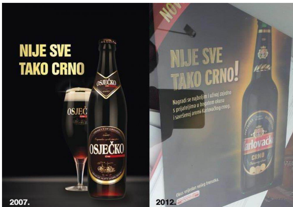
Slika 4.15 – primjer plagiranja oglasa u Republici Hrvatskoj

Na slici 4.15 primjer je kopiranja slogana. Osječka pivovara je 2007. godine u svom oglasu za tamno pivo imala slogan „Nije sve tako crno“ ispisan zlatnim slovima na crnoj podlozi. Godine 2012. Karlovačka pivovara pokrenula je kampanju s istim sloganom u oglasima za svoje tamno pivo.