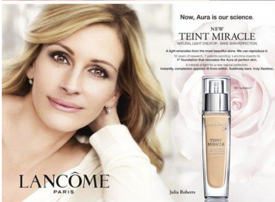
Slika 4.2 - primjer zavaravajućeg oglašavanja za kreme

Na slici 4.2 nalaze se dva primjera zavaravajućeg oglašavanja, koje je također ASA u Velikoj Britaniji zabranila. Oglasi su zabranjeni jer su modeli na fotografijama pretjerano izglađeni putem programa za uređivanje fotografija. Takvim pristupom prenaplašava se učinkovitost proizvoda.