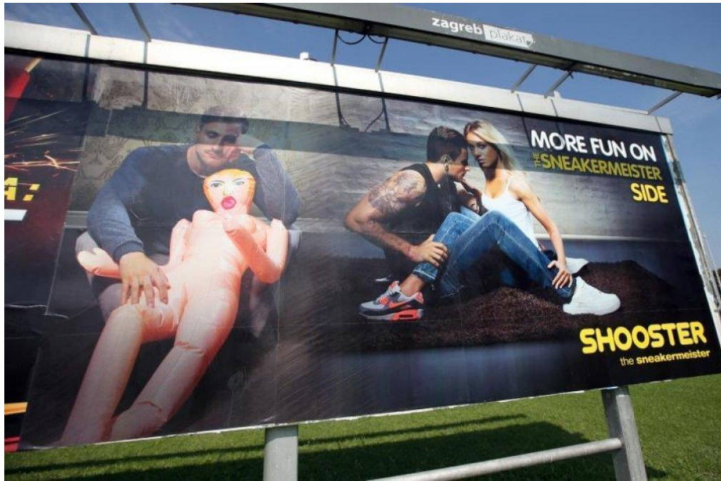
Slika 4.11 – primjer oglasa kompanije Shooster koji narušava načelo pristojnosti

Na slici 4.11 nalazi se primjer oglasa kompanije Shooster koji se pojavio na jumbo plakatima u Republici Hrvatskoj. Oglas narušava načelo pristojnosti, a time i drugi članak Kodeksa oglašavanja i tržišnog komuniciranja. Prema tom članku tržišna komunikacija ne bi smjela narušavati standarde pristojnosti u nekoj državi i kulturi.