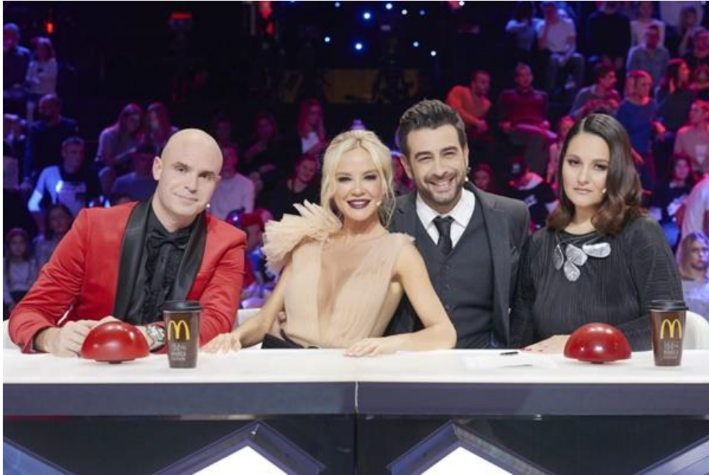
Slika 4.5 - Product placement branda McDonalds u emisiji Supertalent (izvor: http://www.showbizmagazin.com/wp-content/uploads/2018/11/Ziri-2-1024x684.jpg )

Slika 4.5 prikazuje prikryveno oglašavanje u emisiji Supertalent koja se emitira u Republici Hrvatskoj. U emisiji su na stolu žirija čaše marke McDonalds s logom okrenutim prema kamerama kako bi on bio vidljiv.