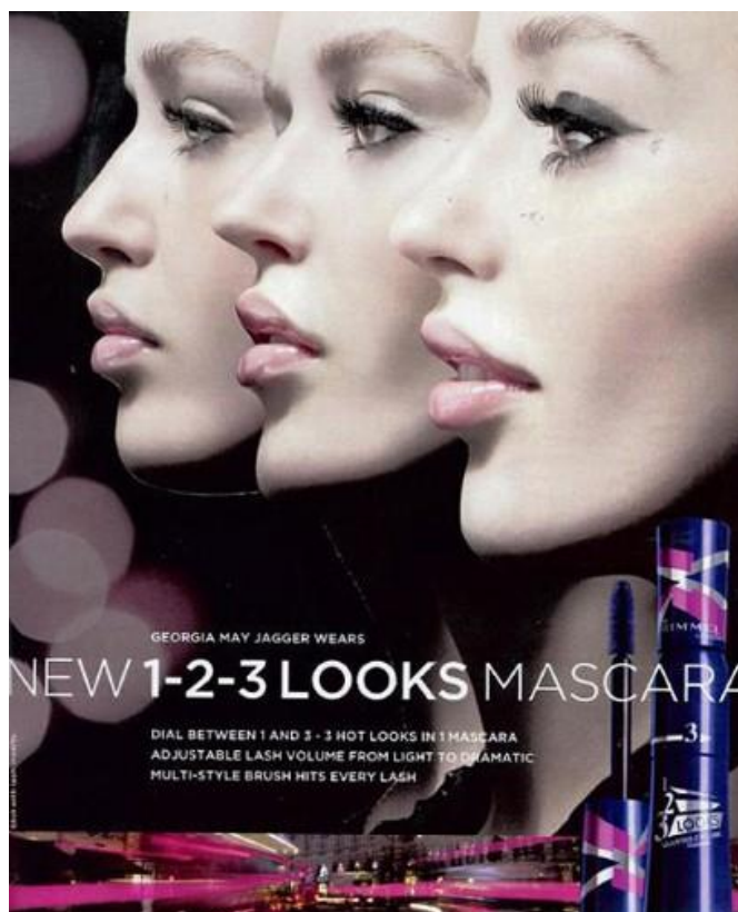
Slika 4.1 primjer zavaravajućeg oglašavanja za maskaru