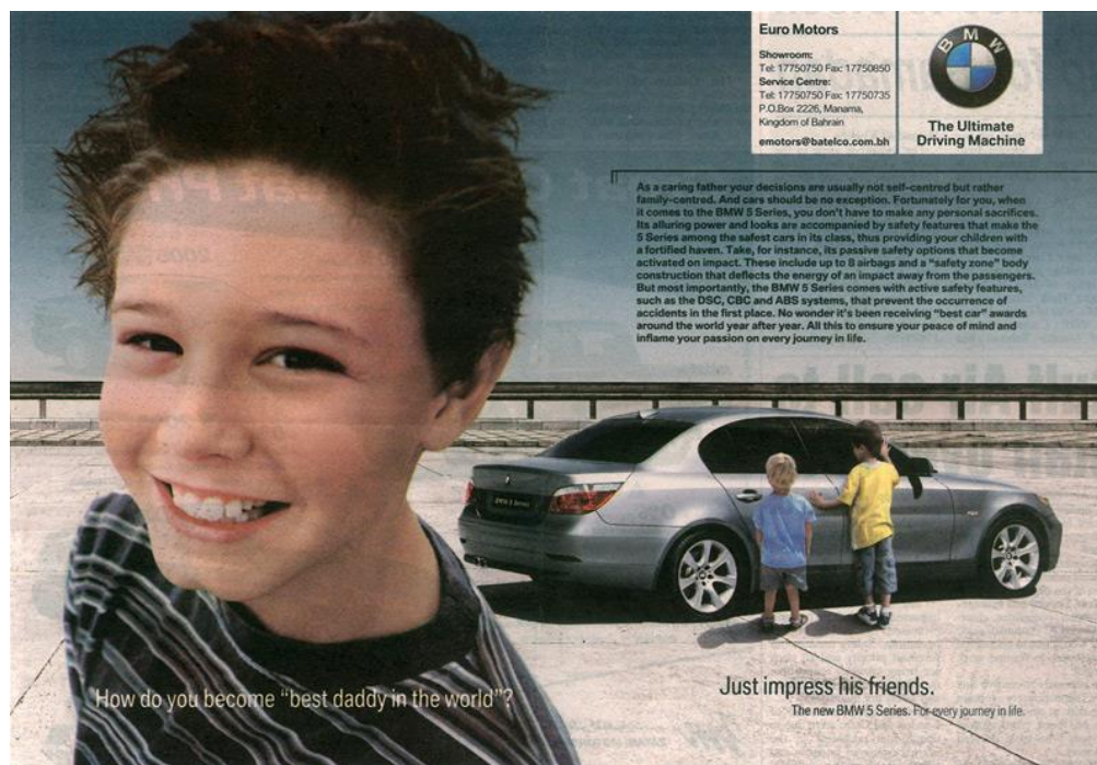
Slika 4.6 – Primjer neetiĉnog korištenja djece u oglasu marke BMW

Na slici 4.6 nalazi se primjer neetiĉkog korištenja ranjive skupine u oglasu. U oglasu za BMW automobil se prikazuje dijete u prvom planu. Pitanje koje se postavlja u oglasu je: „Na koji se naĉin postaje najbolji tata na svijetu?“, a kao odgovor naveden je sljedeći: „Samo trebate oduševiti njihove prijatelje.“. U ovom se oglasu iskorištava roditeljska ljubav prema djetetu jer će oni napraviti sve kako bi njihovo dijete bilo sretno. U pozadini se vide i prijatelji djeteta kako su oduševljeni automobilom koji vozi tata djeteta. Dijete u prvom planu vrlo je sretno i ponosno, a stav tijela njegovih prijatelja sugerira da bi i oni htjeli da njihov otac vozi takav auto. Takav oglas nipošto nije etiĉan jer promiĉe i materijalizam koji je sve izraženiji u današnjem svijetu.