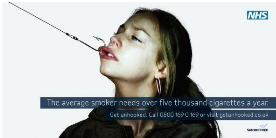
Slika 4.9 - primjer korištenja šoka u oglasu