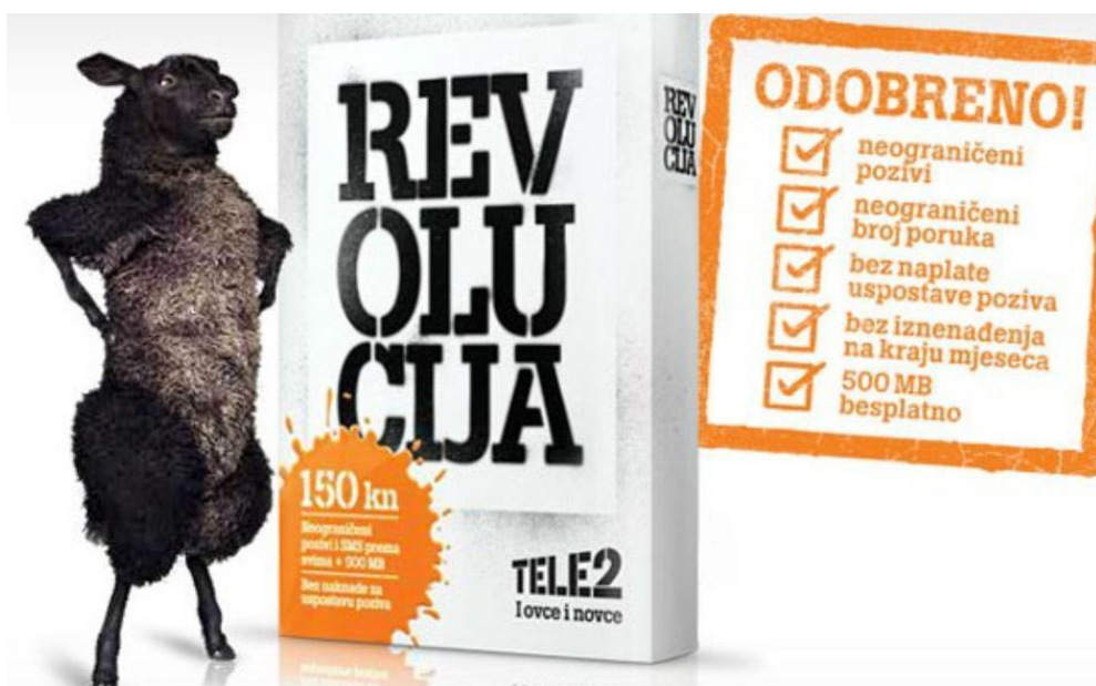
Slika 4.3 - primjer zavaravajućeg oglasa kompanije Tele 2 ( izvor: https://www.24sata.hr/media/img/ca/0d/e4fda78af250290533e7.jpeg )

Na slici 4.3 nalazi se primjer zavaravajućeg oglašavanja u Republici Hrvatskoj. Kompanija Tele 2 u svom oglasu tvrdi kako u tarifi Revolucija postoje neograničeni pozivi i poruke te kako nema iznenađenja na kraju mjeseca. Nažalost, kompanija je odmah u ugovoru ograničila količinu poziva i poruka, pa se u oglasnoj poruci zapravo iznose neistine te se potrošači na taj način zavaravaju.