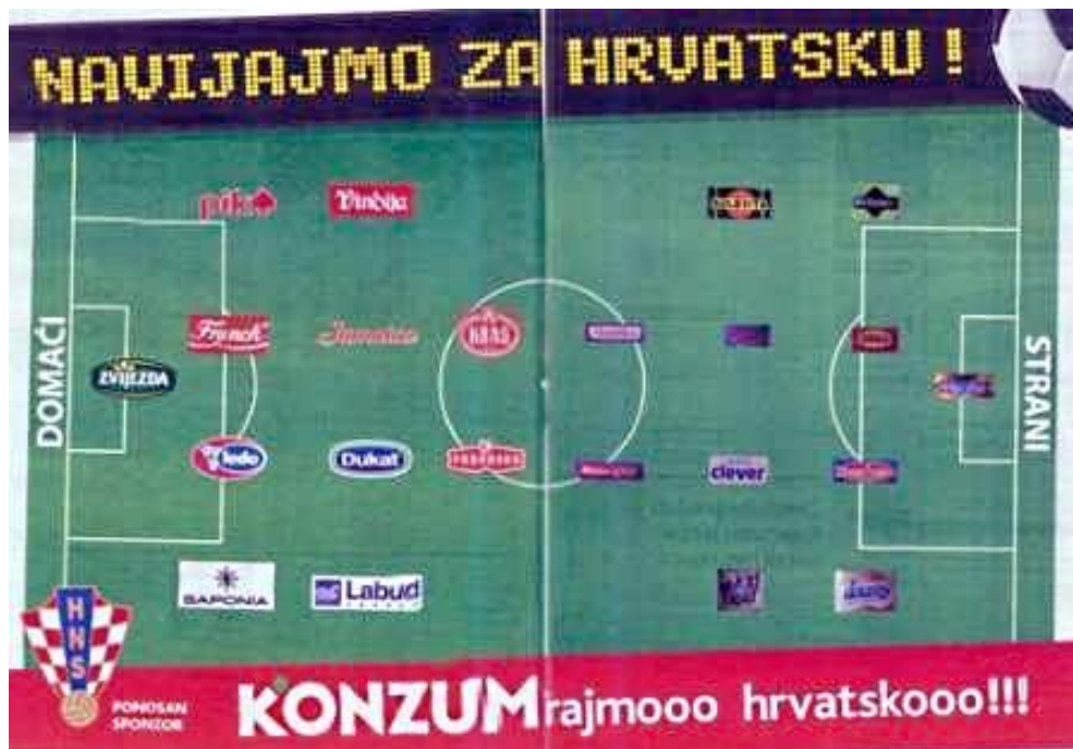
Slika 4.8 - primjer komparativnog oglašavanja kompanije Konzum (izvor:

http://arhiva.nacional.hr/img/5/0/a/50a450cb225e1127dca856bf59dc45cf_700x550.jpg )