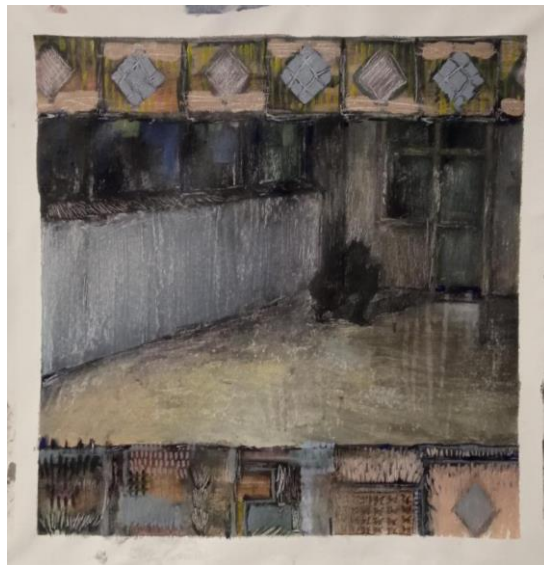
“iluzija mraka”, akrilik na platnu, 30x30cm, 2023./2014.