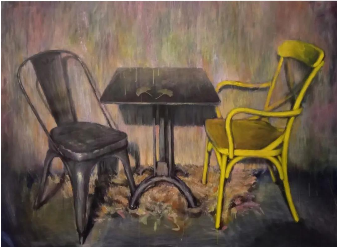
“Razgovor” akrilik na platnu, 100x140cm, 2023./2024.