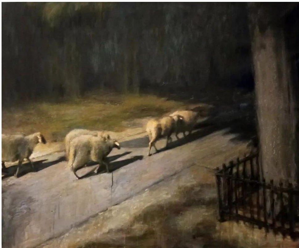
“Put u nepoznato”, akrilik na platnu, 130x100cm, 2023./2024.