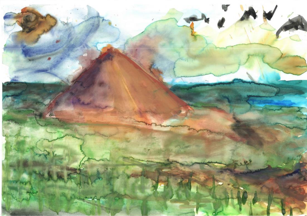
Slika 2: „Priroda stvari“