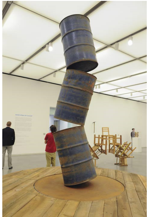
Damian Ortega - False movement