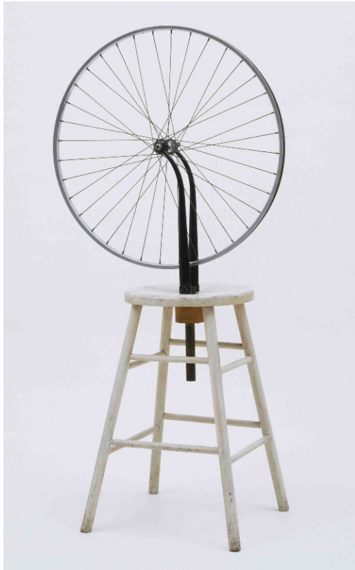
M. Duchamp, Bicycle-wheel 1913 g.