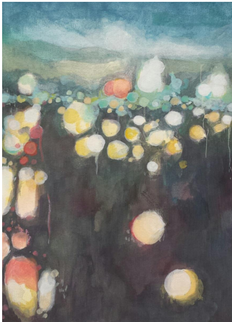
Skice: akvarel i gvaš na papiru