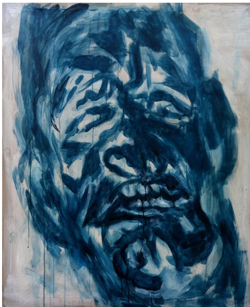
Gubavac II , 2018., akril na papiru

Na kraju se dogodila ta suprotnost da poznatim osobama iz obiteljskog albuma na slici izostavljam lica kao glavnu oznaku identiteta i pronalazim ga u njihovim radnjama, postupcima i odnosima, a identitet gubavaca pronalazim upravo u ekspresijama njihovih lica. U tom smislu postoji poveznica između tih dvaju ciklusa.