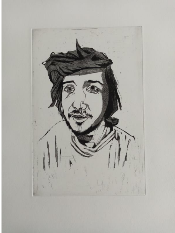
Autoportret, 2019., bakropis i akvatinta, 20x30