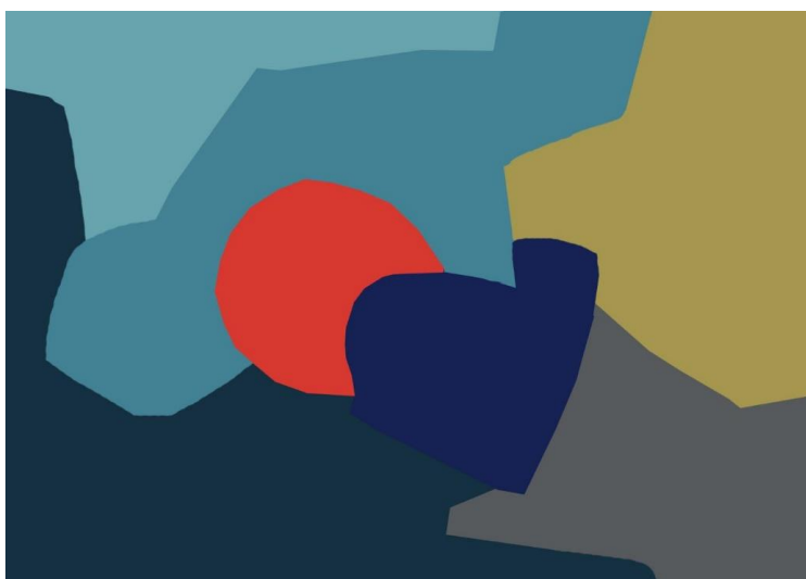
Slika 2. Koloristička skica za „Pomrčinu“