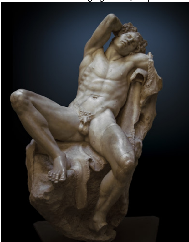
Primjer 7, nepoznati helenistički kipar Pergamene škole, Barberini Faun, mramor, 215cm, Glijptoteka Minhen, Njemačka

Radove koje povijest umjetnosti priznaje kao umjetnost iako prikazuju erotsku muževnost su većinom skulpture iz antičke grčke. Meni najdraži primjer je skulptura Barberinijevog Fauna, koja predstavlja usnulog satira u pasivnoj pozi, ne kao seksualnog agresora (kako se satri inače prikazuju) već kao objekt požude. Skulptura je iz helenističkog perioda (cca. 323-31 p.n.e.) u kojem osobni aspekti pojedinca u (romantičnoj/seksualnoj) vezi su stavljeni na prvo mjesto. Time oba partnera mogu izraziti svoje želje i požude, te biti aktivna ili/i pasivna uloga u svojoj vezi, što mijenja shvaćanja i samih seksualnih uloga. To se odražava i na umjetnost u helenizmu: skulpture se počinju izvijati iz statičnih poza i postaju dinamične, također sam narativ i protagonist skulpture postaje dinamičniji. Više nije samo mlad muškarac ili djevojka objekt požude- to postaje i odrastao muškarac. Tako se normaliziraju odrasli, mišićavi i dominantni muškarci u skulpturi kao protagonisti što otvara mogućnost satiru- simbolu seksualnog agresora, da postane objekt požude.