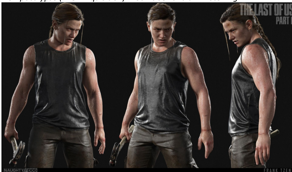
Primjer 2, Dizajn lika "Abby" 10

mogućnost mišićave žene u igri i općenito, komično je prezentirano u videu Muscles Of The Apocalypse (The Jimquisition) 8 You Tube kanala Jim Sterling 9 .