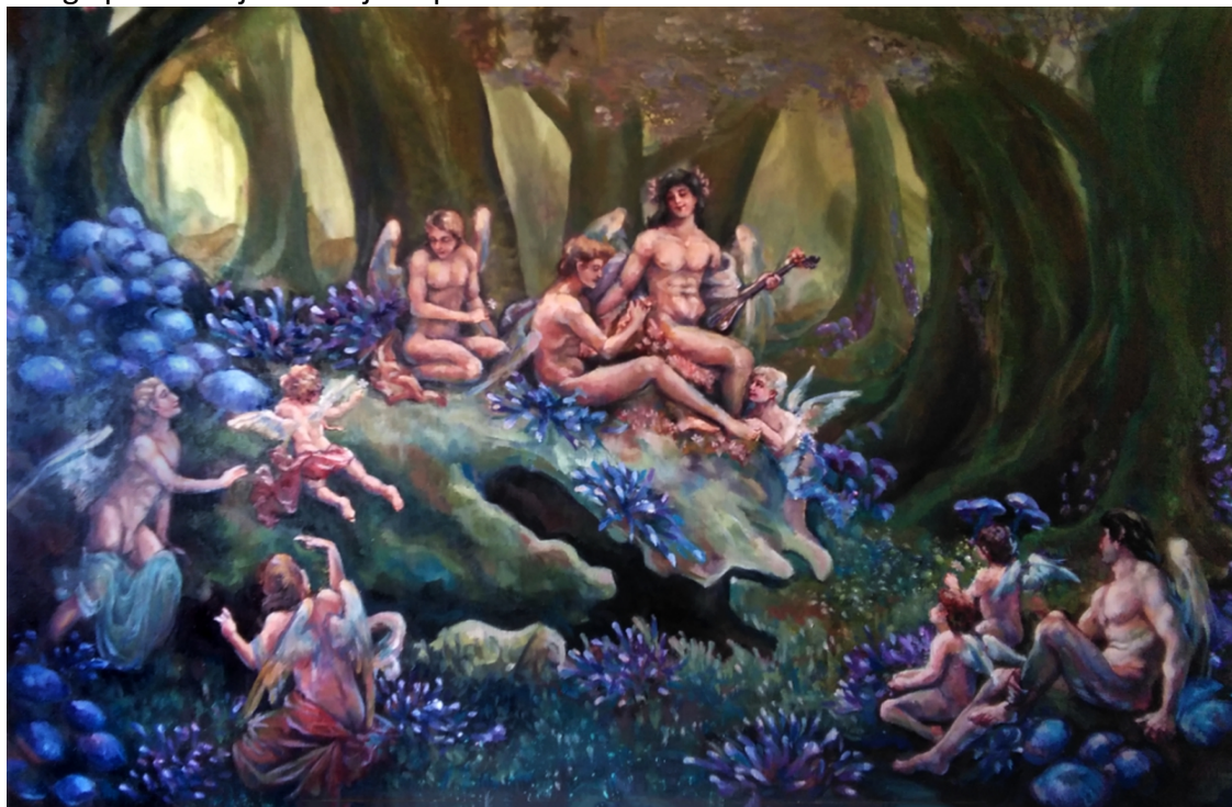
Slika 2, Emotivni , ulje i UV print na platnu, 79 x 116 cm

U radu Emotivni prikazujem zajednicu ljudi, kako zajedno sudjeluju u emocionalnom kolapsu pojedinca. On nije sam i izoliran, nego priznaje svoje stanje drugima, oni ga slušaju i sudjeluju u njegovom problemu. Ne osuđuju ga zbog toga već ga pokušavaju razumjeti i pomoći mu da se suoči sam sa sobom.