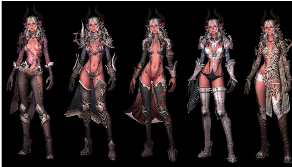
Primjer 1 Koncept za odjeću ženskih likova, Tera online 6

Umjetnost i povijest, kroz stoljeća, stvorili su u društvu percepciju o rodovima gdje je muškarac uvijek heroj i da tome mora težiti, dok je žena nagrada za njegova djela, mora mu služiti i biti pokorna. To je danas najviše očito iz popularne kulture i medijima kao što su filmovi, TV serije te video igre. Muškarac je uvijek prikazivan kao snažan i jak, mišićav i grub, nikako erotičan ili seksualiziran. Dok je žena jedino relevantna ako je lijepa i privlačna (u seksualnom smislu). Ako žena uzima glavnu ili drugu glavnu ulogu, njena snaga i moć ne dolazi iz njene mogućnosti da pobjedi protivnika, nego da ga šarmira svojom ljepotom. Drugim riječima, njena moć dolazi iz toga što je seksualizirana svojim dizajnom (Primjer 1). U svom YouTube videu: Lingerie is not Armor - Tropes vs Women in Video Games 4 , Feminist Frequency 5 ukazuje baš na taj problem u pop kulturi, video igre specifično. Jake i neovisne žene izjednačavaju sa seksualiziranim ženskim tijelom i pokretom što stvara toksične predrasude i očekivanja od žena i muškaraca u društvu: relevantne žene su one koje su lijepe i seksualizirane, a muškarci moraju biti jaki i grub, te su uvijek heteroseksualni.