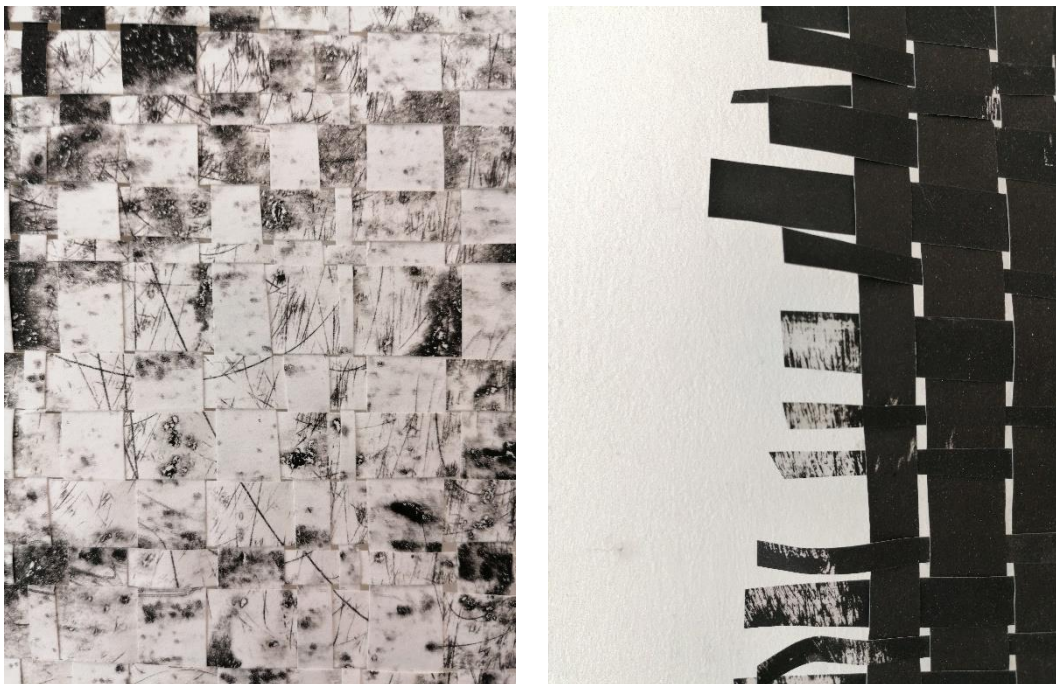
Planovi - detalj

Kako bih krenula u istraživanje, bilo je potrebno osloboditi se poznatih prostornih planova te se kroz pletenje poznatih motiva brežuljaka igram s planovima; ono što je nekad trebalo biti iza, sada se ritmično izmjenjuje, pa u jednom trenu taj mali segment bude u prednjem planu, a ubrzo nakon toga bude u stražnjem. Planovi su pomiješani, nejasni te stvaraju određenu konfuziju i novi imaginarni prostorni plan.