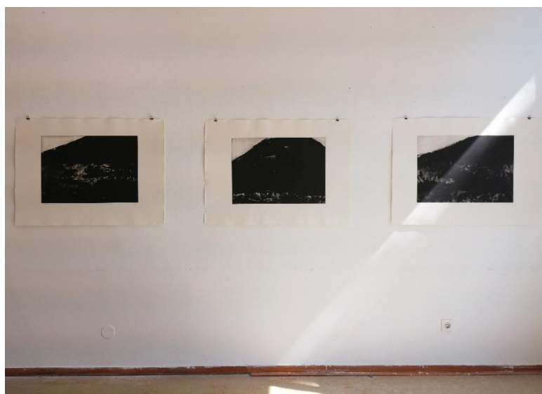
Planovi - grafički otisci, postav u prostoru