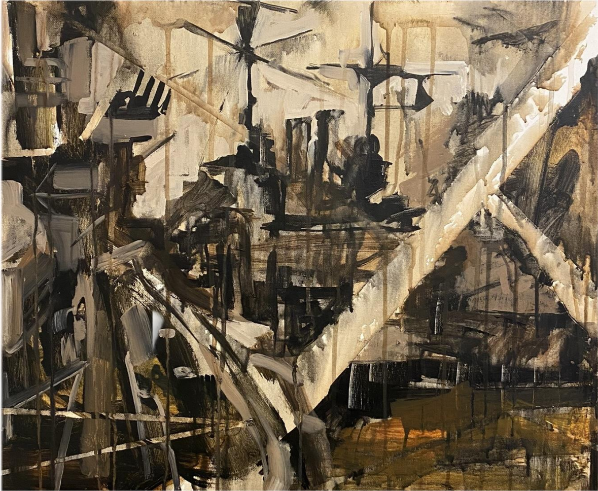
Slika 7. Bez Naziva 2023. 50x60cm, akril na platnu