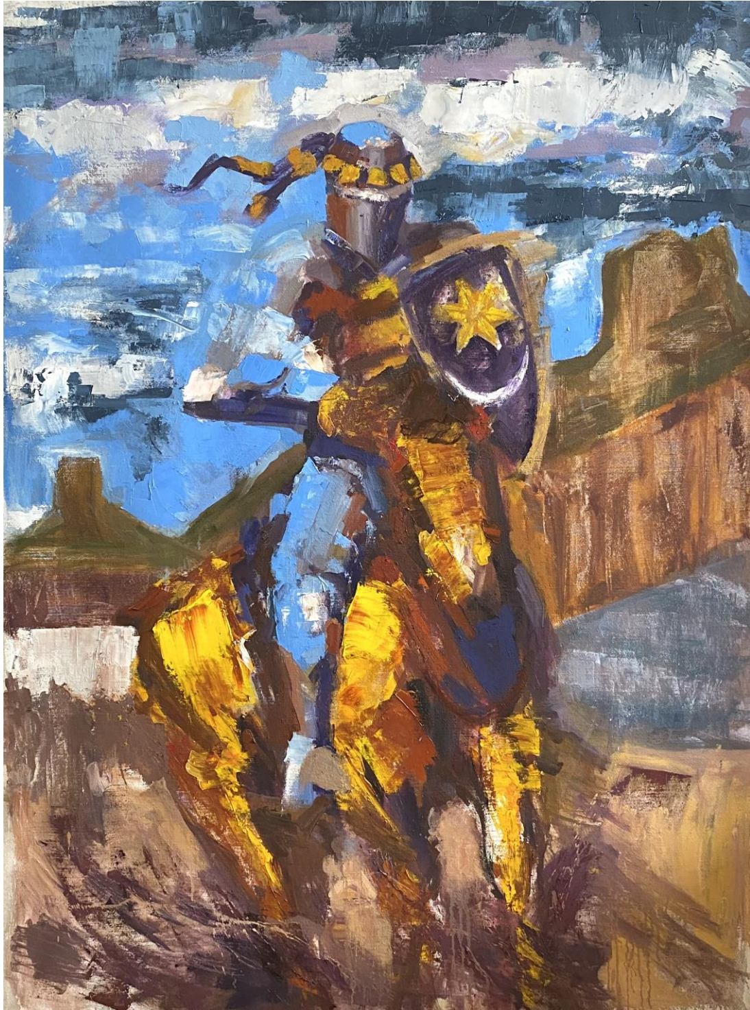
Slika 5. Bez Naziva 2022. 180x150cm, ulje na platnu