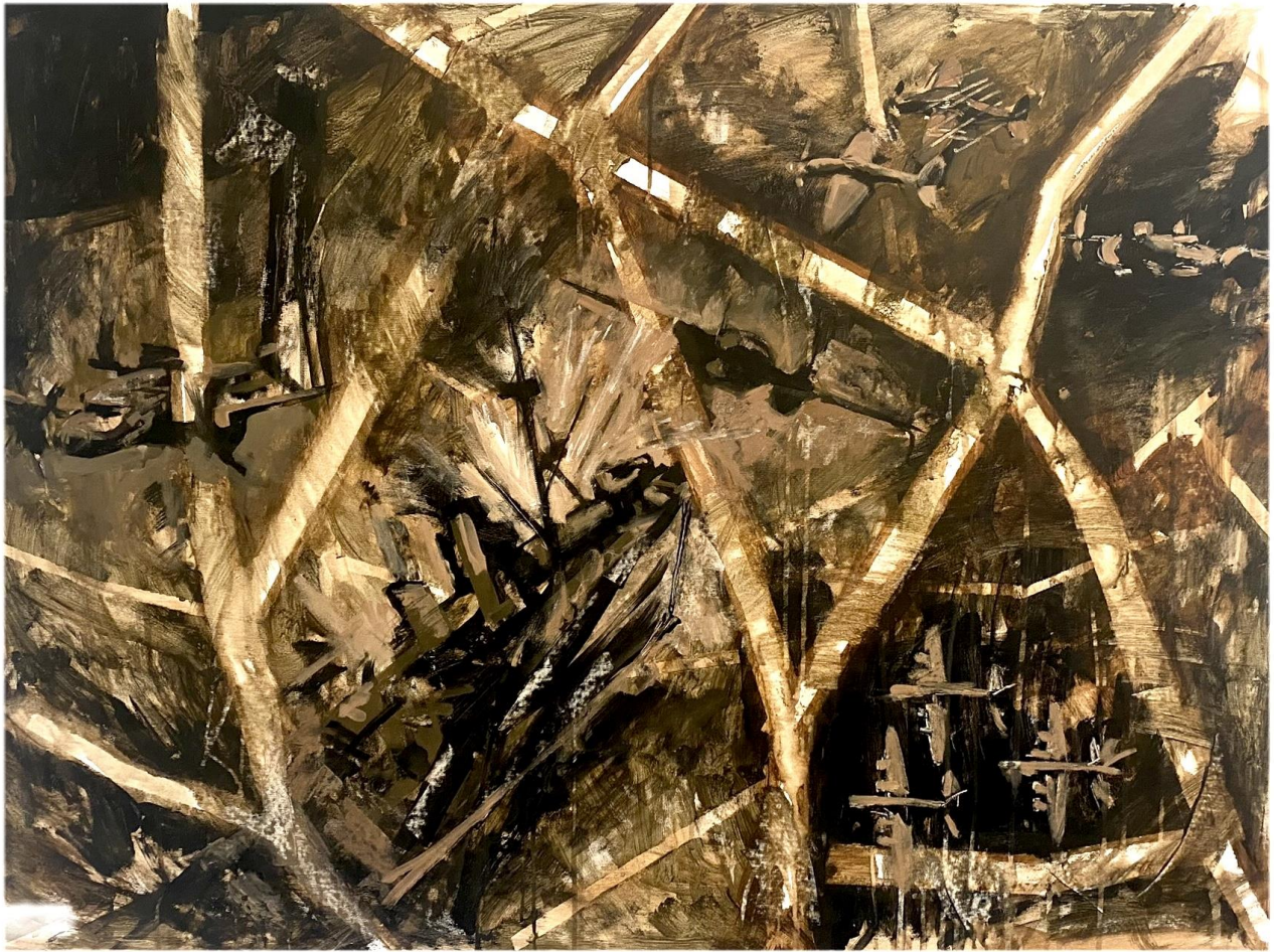
Slika 6. Bez Naziva 2023. 130x100cm, akril na platnu