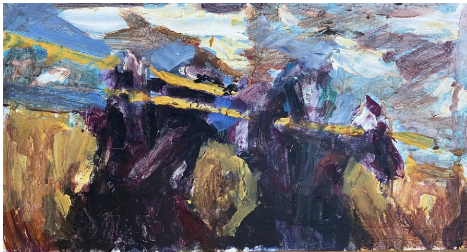
Slika 2. Bez Naziva 2022. 28x52cm, akril na drvenoj dasci