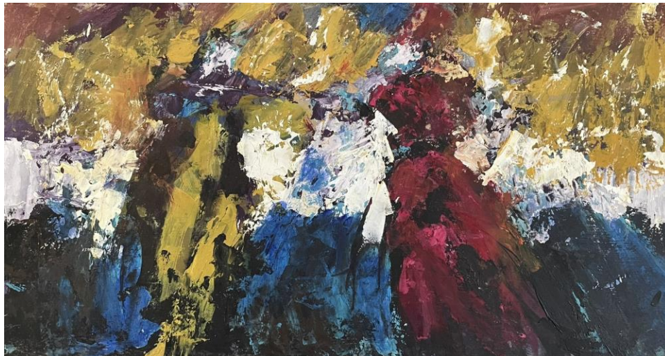
Slika 1. Bez Naziva 2022. 28x52cm, akril i kit za drvo na drvenoj dasci

dovoljno otvoreni da promatrač može u njima pronaći vlastito značenje, ispričati svoju priču o njima.