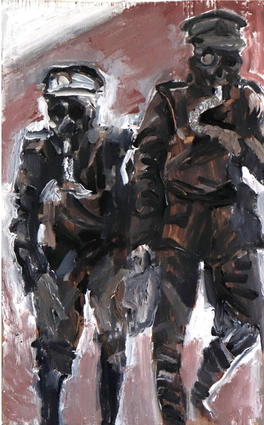
Slika 9. Bez Naziva 2023. 50x30cm, akril na drvenoj dasci