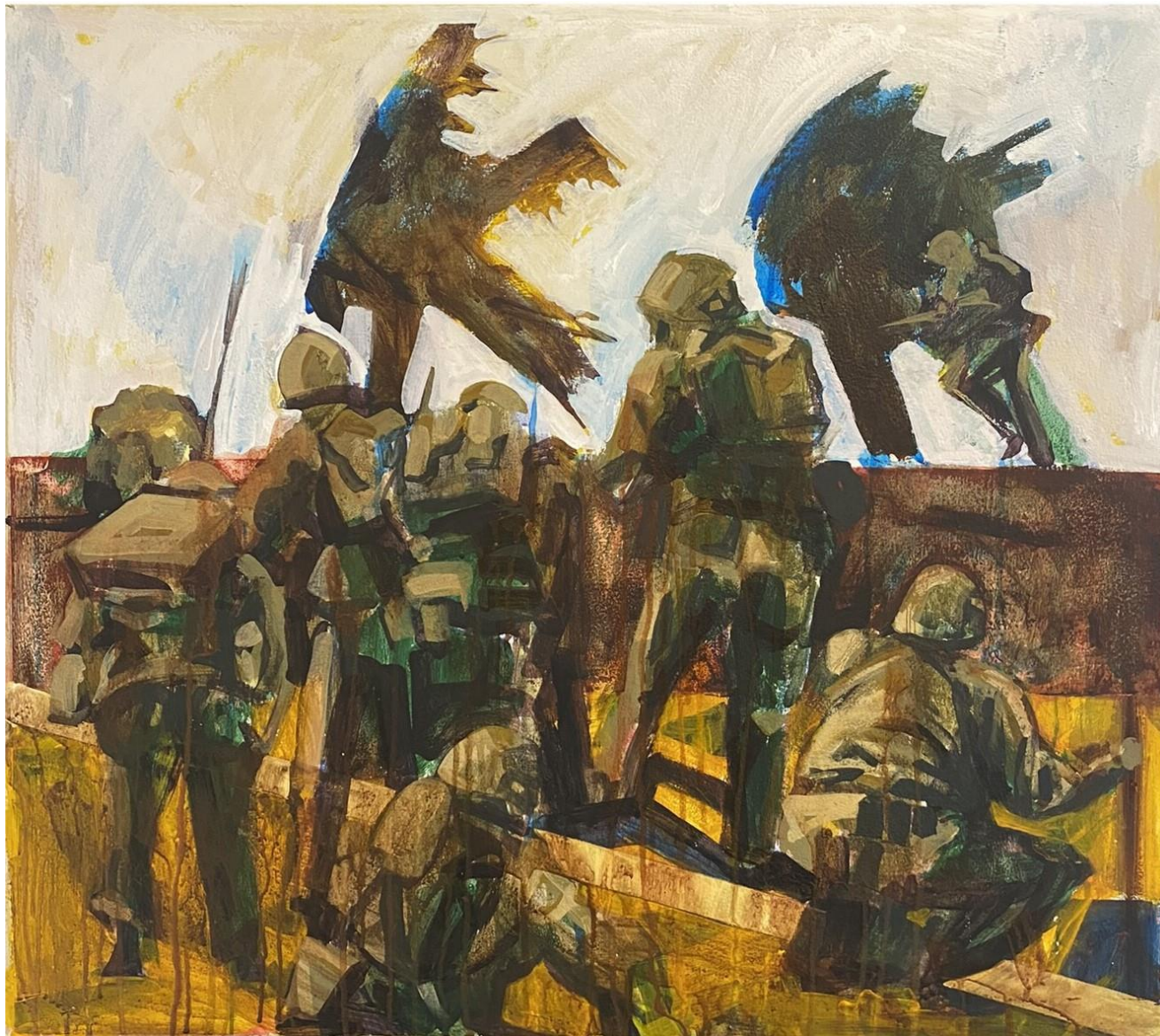
Slika 11. Bez Naziva 2023. 85x65cm, akril na drvenoj dasci