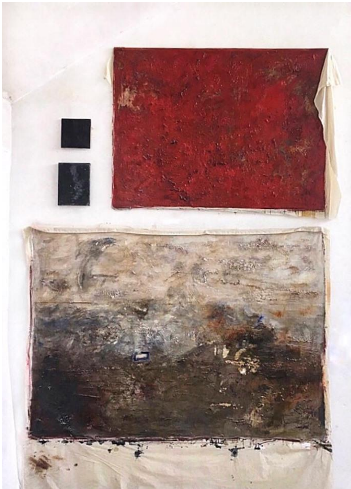
Bez naziva, 2019., gips i ulje na platnu