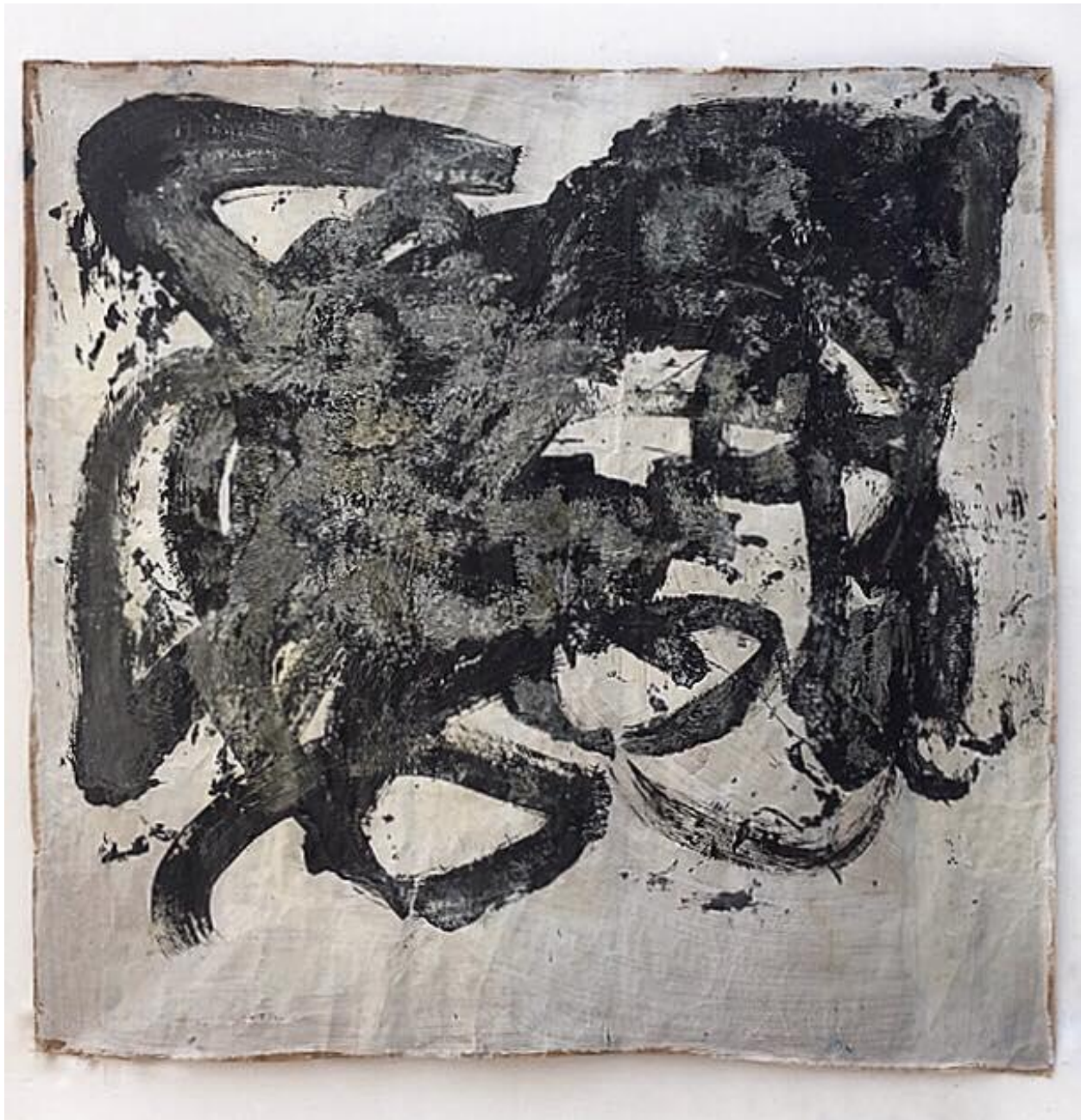
Crna linija , 2019., akril, gips i lak na papiru