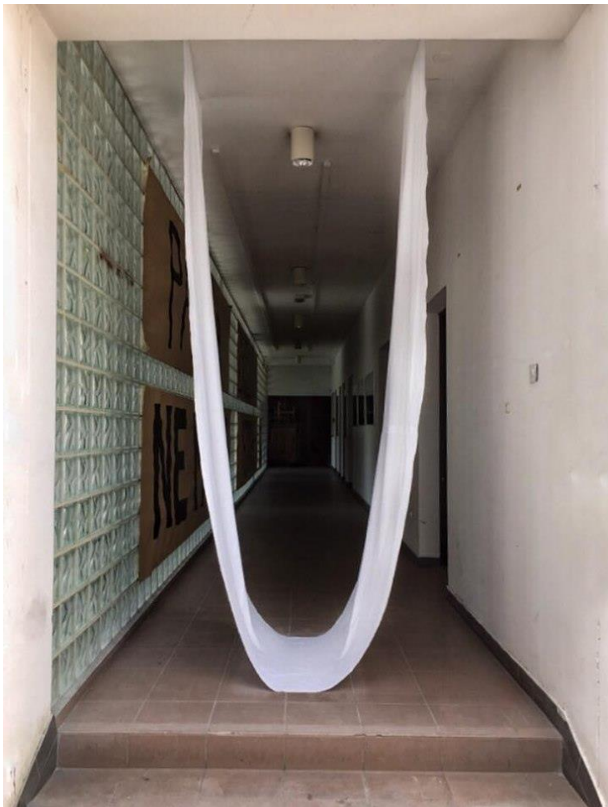
Bijela draperija, 2019., tkanina