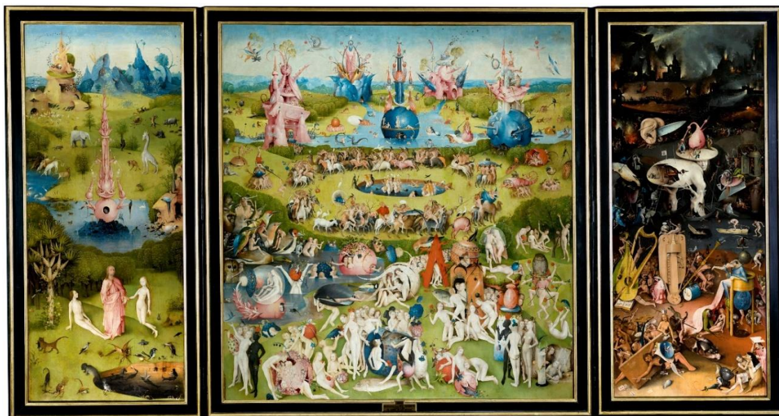
Slika 1: Hyeronimus Bosch, Vrt zemaljskih naslada , oko 1500. godine, ulje na dasci, 205.5 cm × 384.9 cm, Museo del Prado, Madrid

Diplomski rad je izveden u dubokotisnoj tehnici bakropisa 4 i suhe igle 5 te se sastoji od tri velike kompozicije. Rad je nadahnut triptihom 6 Hyeronimusa Boscha, 7 Vrtom zemaljskih naslada , datiranog oko 1500. godine (slika 1).