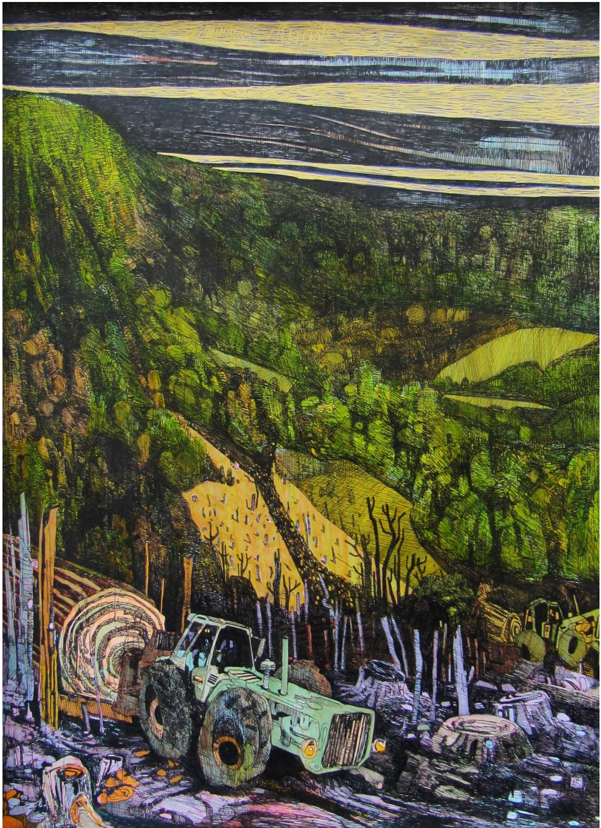
Slika 8: Još jedna verzije kompozicije za prvu ploču