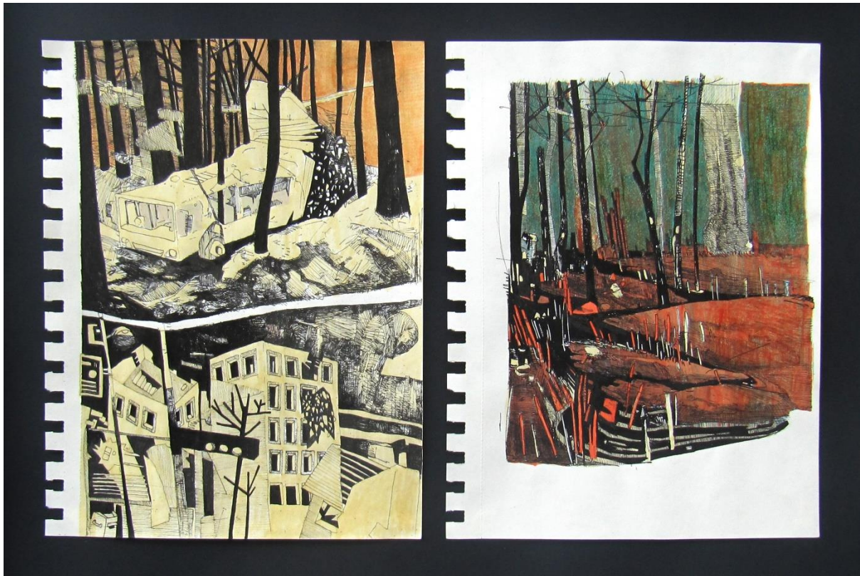
Slika 11: Skice korištene za prikaz ambijenta na velikim formatima; korištena je kombinacija lijevog i desnog crteža