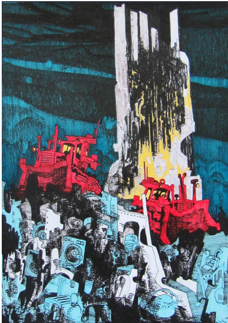
Slika 7: Rana ideja za prikaz na prvoj ploči; okoliš zatrpan smećem dok se u pozadini nazire stablo koje je zbog svoje veličine uspjelo izbjeći sječu

Navedeni pristup koristim kao određeni standard kojeg se držim kako proces crtanja ne bi bio prekinut, a dotok novih ideja te potencijalnih (i potrebnih) poboljšanja zanemaren. Vjerujem kako mi je navedeni način rada, implementiran tijekom čitavog studiranja, izrazito mnogo koristio za usavršavanje te ću se te dinamike nastojati držati i dalje.