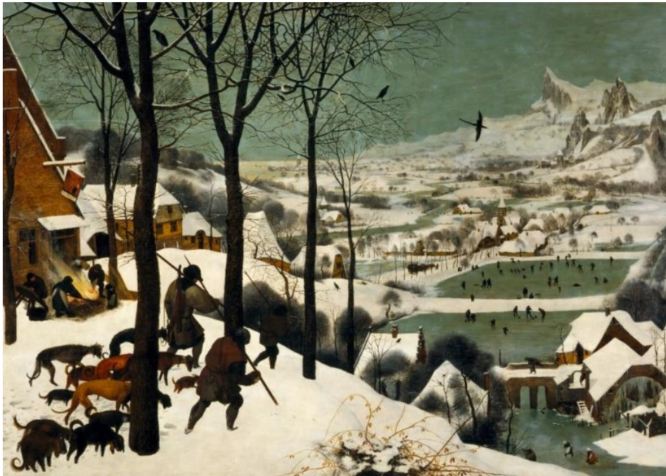
Slika 2: Pieter Bruegel, Lovci u snijegu , 1565., uljane boje na dasci, 117 × 162 cm

Uz Hyeronimusa Boscha, umjetnik koji je također utjecao na moj rad je Pieter Bruegel (slika 2). Oba umjetnika su poznata po kompleksnim kompozicijama te je za iščitavanje detalja sa njihovih veličanstvenih pejzaža potrebno pažljivo promatranje. 8 U likovnim umjetnostima, slika, grafika ili reljef koji prikazuje krajolik ili pejzaž 9 kao samostalna likovna tema nije postojao u svim razvojnim razdobljima slikarstva.