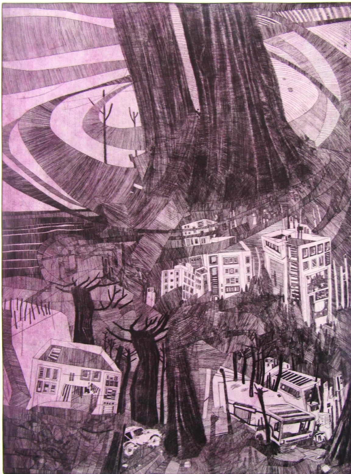
Slika 4: Druga ploča