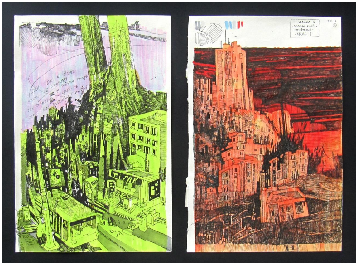
Slika 10: Skice za središnju ploču; kombinacija oba prikaza iskorištena je kao rješenje na velikom formatu