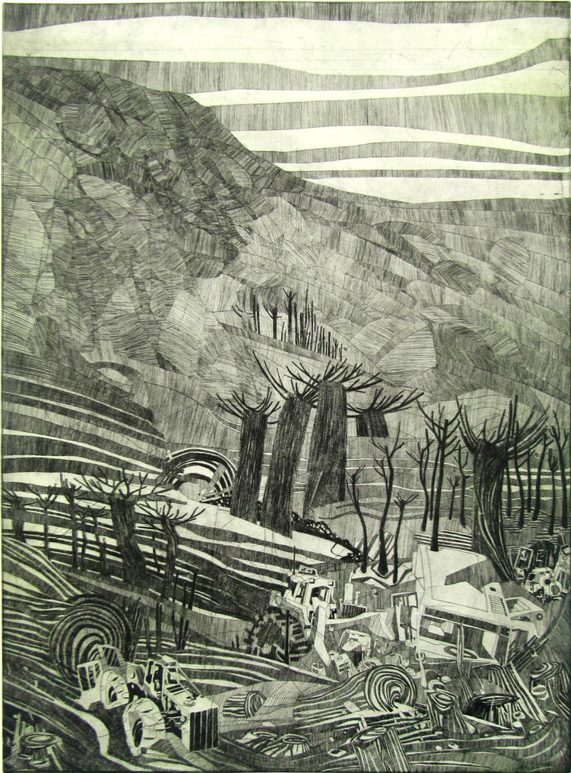
Slika 3: Prva ploča