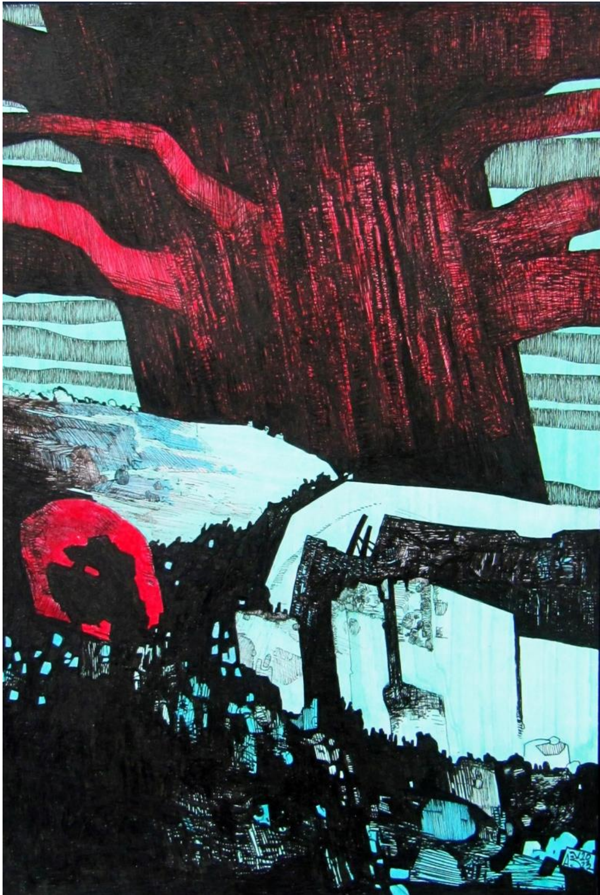
Slika 12: Rana skica za treću ploču; prikazuje čovječanstvo na putu prema iskupljenju; portal u stablu se još nije javio kao ideja u ovoj verziji priče