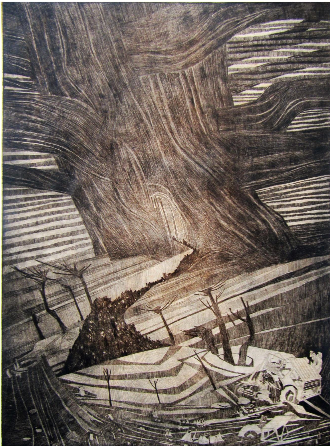
Slika 5: Treća ploča