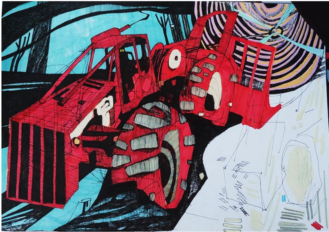
Slika 9: Skider; skica za prvu ploču