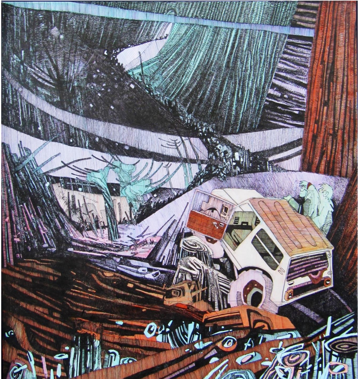
Slika 13: Kasnija verzija skice za treću ploču; u odnosu na raniju skicu scena uključuje protagoniste inspirirane stvarnim osobama, razrađeniji krajolik te portal u stablu