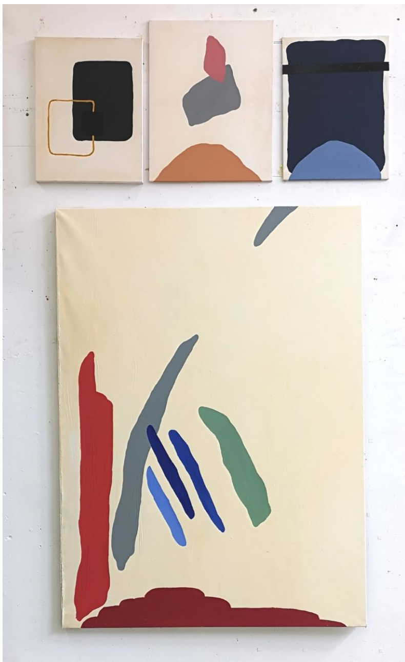
Izadi iz okvira, 2019., akril na platnu