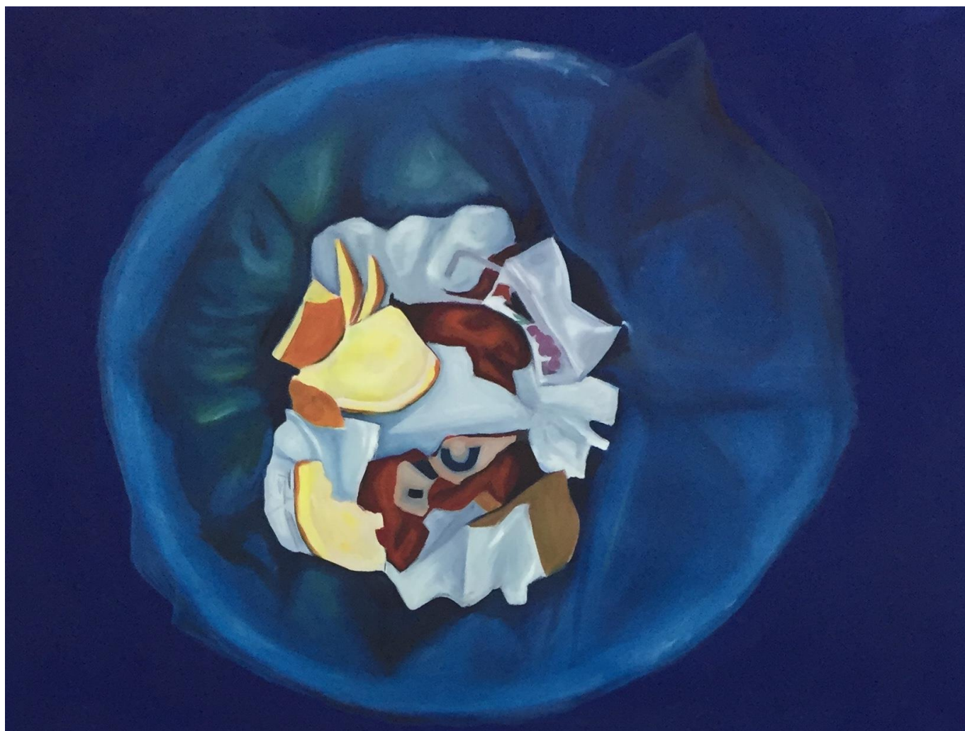
Smeće, 2018., kombinirana tehnika