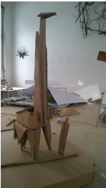
Žirafa maketa, 2018, karton

Uz kartonsku žirafu nalazi se prikaz čovjeka (promatrača) u mjerilu, kao ideja za ostvarenje skice u većim dimenzijama i drugačijem materijalu. Druga fotografija prikazuje žirafu izvedenu u kombiniranoj tehnici. Napravljena je od višeslojnog stiropora koji je ručno zaglađen i oblikovan brusnim papirom. Rubovi su zaobljeni materijal, materijal dozvoljava fino oblikovanje, a samim time karakter skulpture je drugačiji. Kaširanjem (papirom) je potom presvučena cijela figura, te obojana kistom i akrilnim bojama. Razigranim potezima kista stvorena je igra linijama koja vodi oko promatrača.