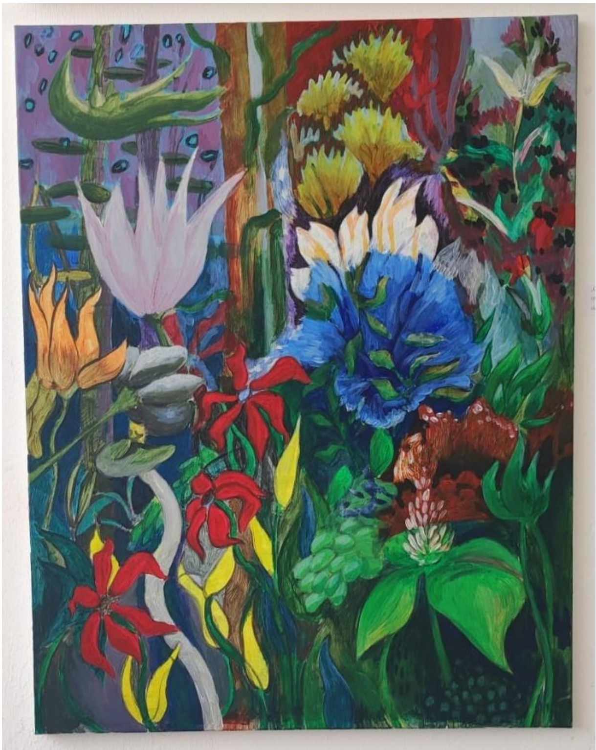
„Cvijeće“, akril na platnu, 80x60