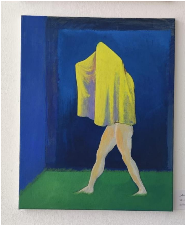
Metafizičko trazenje, ulje na platnu, 50x40