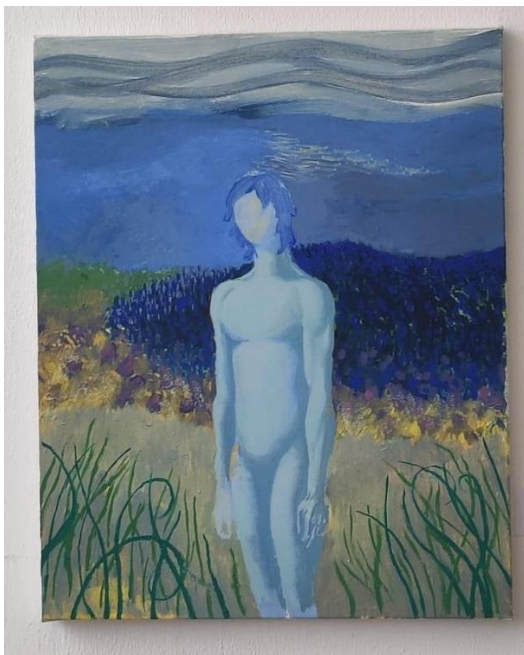
„Vjetar“, ulje na platnu, 50x40