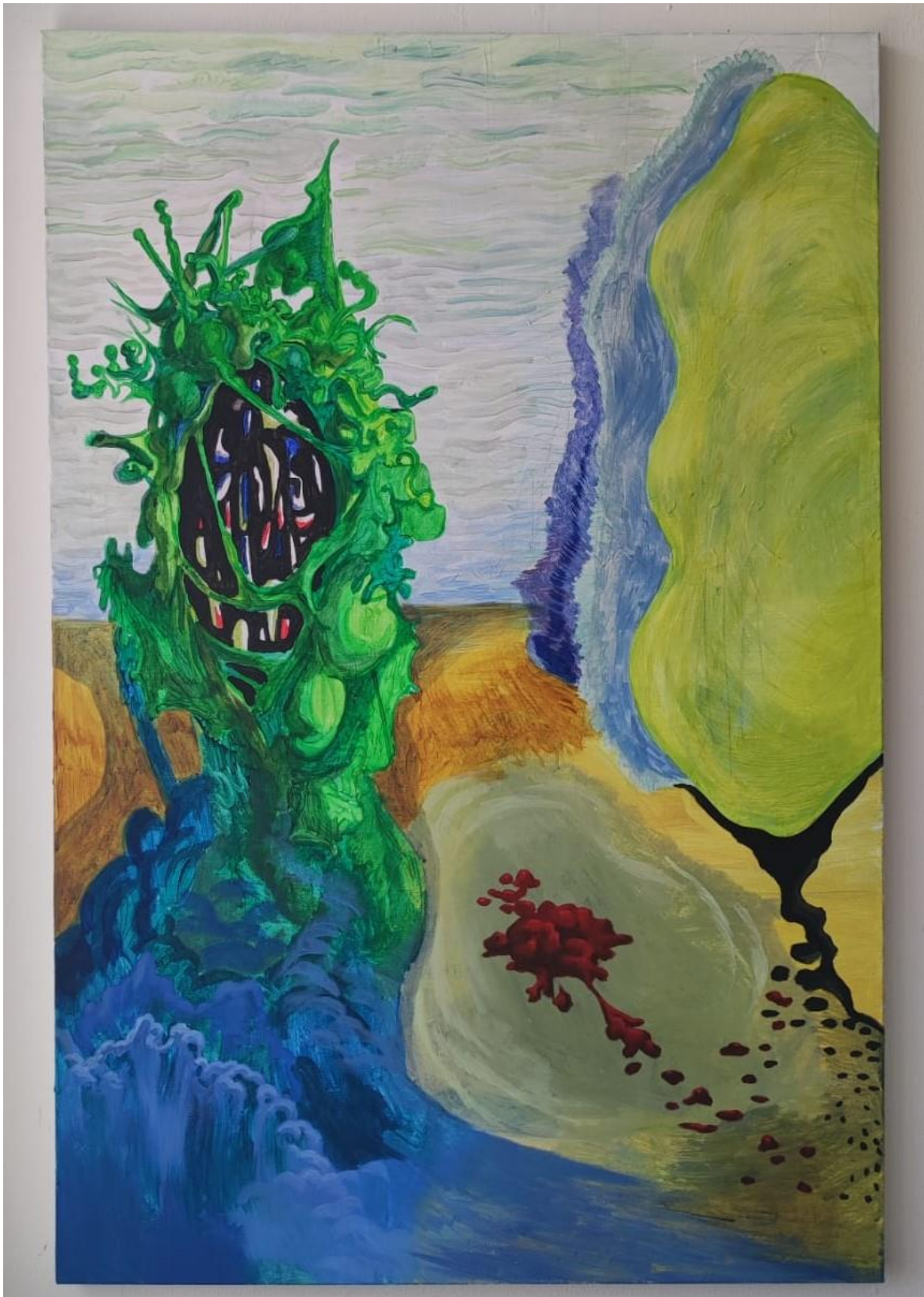
Metamorfoza, akril na platnu, 120x80