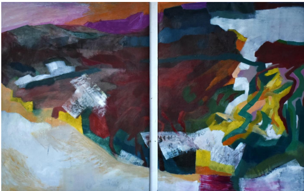
Razgradiv pejzaž (žuta-ljubičasta), diptih, 127x98cm, 2019.