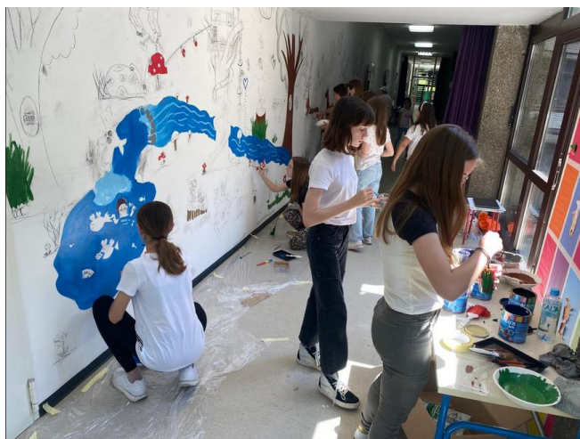
Fotografija 7: Oslikavanje zida, peti susret