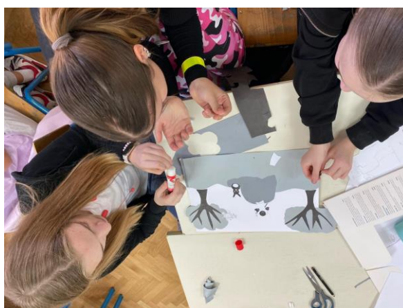
Fotografija 3: Dovršavanje kolaža, drugi susret

Drugi je susret započeo prezentacijom te uvodnim slajdom na kojemu su sadržane informacije o tome što se od učenica očekuje. Učenice su dovršile predloške u kolažu, a završeni su predlošci fotokopirani i isprintani na papir A3-formata kako bi se originalni predlošci očuvali. S učenicama je potom provedena metoda oluje mozgova – potaknulo ih se na zajedničku suradnju, tj. na to da odluče kako spojiti dvije ideje u skladnu cjelinu s obzirom na to da su korištene različite perspektive. Učenice su se brzo zainteresirale i aktivno su sudjelovale. Posljednji se je zadatak ticao određivanja kromatske boje likova s predložaka kako bi se unaprijed što bolje pripremile za oslikavanje.