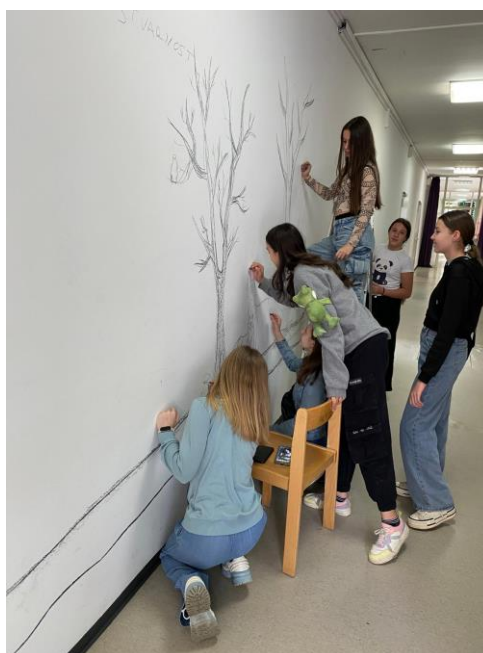
Fotografija 5: Suradnja s učenicama iz Slovačke, treći susret

Na trećem su se susretu učenice bavile prenošenjem crteža na zid, a pozornost je bila usmjerena na omjere i proporcije. Učenice su samostalno prenosile motive krenuvši od jednog motiva koji je funkcionirao kao usidrenje za ostale – u ovom je slučaju to bio motiv potoka koji se proteže cijelim zidnim oslikom. U početku su učenice bile oprezne promišljajući o tome kako će započeti. Kako bi se više oslobodile, demonstrirano im je crtanje ugljenom koje je podrazumijevalo povlačenje široke linije položenim ugljenom i naknadno brisanje. Time je učenicama je pokazano da nema krivih linija i da su pogreške dijelom procesa, a rezultiralo je većom zanimacijom za postavljanje crteža. Na trećem su susretu sudjelovale i učenice iz Slovačke koje su odlično surađivale s učenicama Osnovne škole Trnsko, što su izrazile i u anketi, o čemu će više biti napisano ispod. Fotografija s trećeg susreta prikazuje učenice Osnovne škole Trnsko skupa s učenicama iz Slovačke – surađuju te postavljaju crtež.