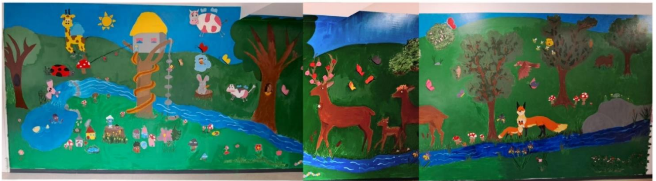
Fotografija 9: Kolaž konačnoga zidnog oslika