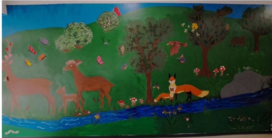
Fotografija 8: Isječak oslikanoga zida, sedmi susret