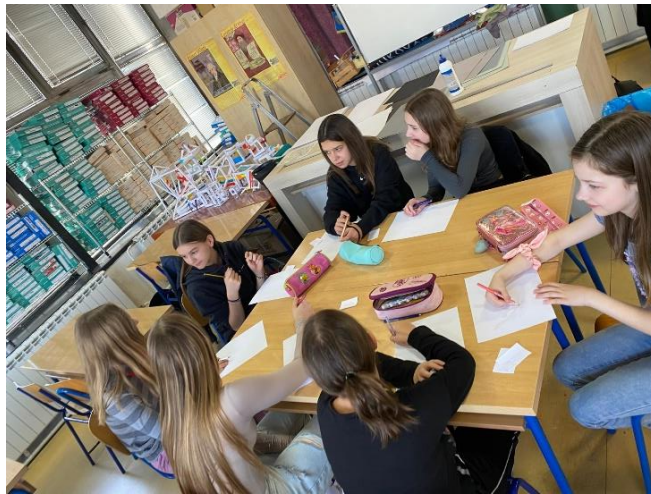
Fotografija 1: Odabir motiva, prvi susret

Druga fotografija prikazuje proces u kojem su odabrane elemente krenule izrađivati u kolažu koji je služio kao skica za daljnji predložak.