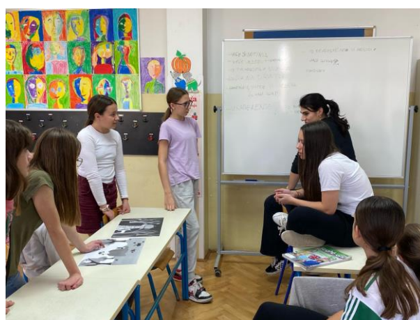
Fotografija 4: Oluja mozgova, drugi susret