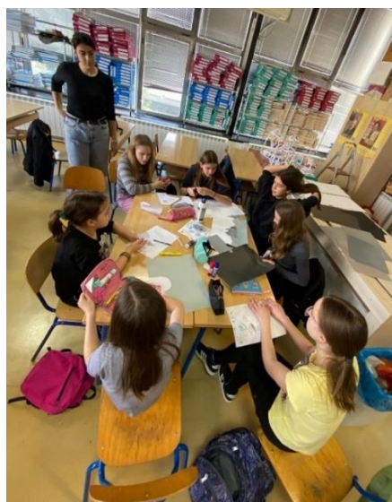
Fotografija 2: Izrada kolaža, prvi susret