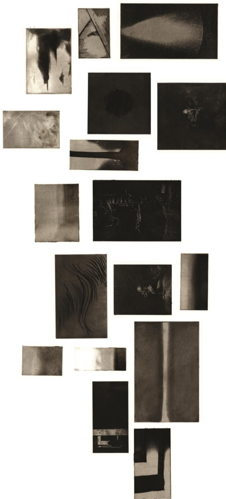
(slika 11. detalj lijevog dijela rada)