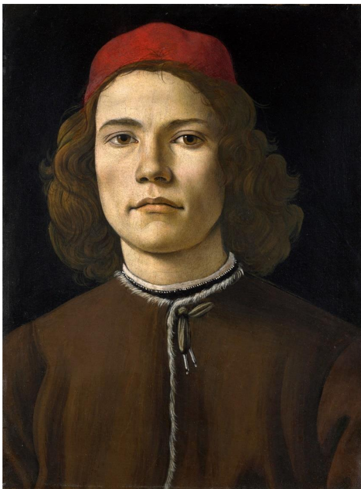
(slika 3., Sandro Botticelli, Portret mladića , 1480., ulje na dasci, 37,5x28,3 cm, National Gallery, London)

slabljenjem ideologije srednjeg vijeka i promjenom odnosa Bog-čovjek, pojam genij i mogućnost stvaranja počinje se pripisivati pojedincu, no on tada i prihvaća teret te riječi (Földényi, 2016.). Ljudi koji su obdareni genijalnošću nisu mogli izbjeći njegove neizbježne posljedice, postali su svjesni svojih neusporedivih vještina ali i svojih ljudskih slabosti i ograničenja. Nitko ih ne ograničava osim njih samih, postaju svoj najgori neprijatelj. Osjećaju se bespomoćno pred sobom i očaj koji to stanje izaziva navodi ih na samodestruktivno ponašanje. „Pravi genij uništava samoga sebe – obavezan je povezati se sa smrću. Genij dovodi čovjeka do samog ruba smrti i obrnuto: onaj tko dođe na sam rub smrti je za dlaku odvojen od genijalnosti.“ (Földényi, 2016. str. 146.). Jaka naklonost suicidu (koja se javlja i u antici i srednjem vijeku) među melankolicima govori o neprestanoj napetosti između kreativnosti života i konačnosti smrti. Onaj tko stvarno uvidi jedinstvenost postojanja, i dalje pokuša stati licem u lice sa smrću, neizbježno će postati genij. Renesansni melankolik postavio je temelje za tumačenje melankolije sve do danas (Földényi, 2016).