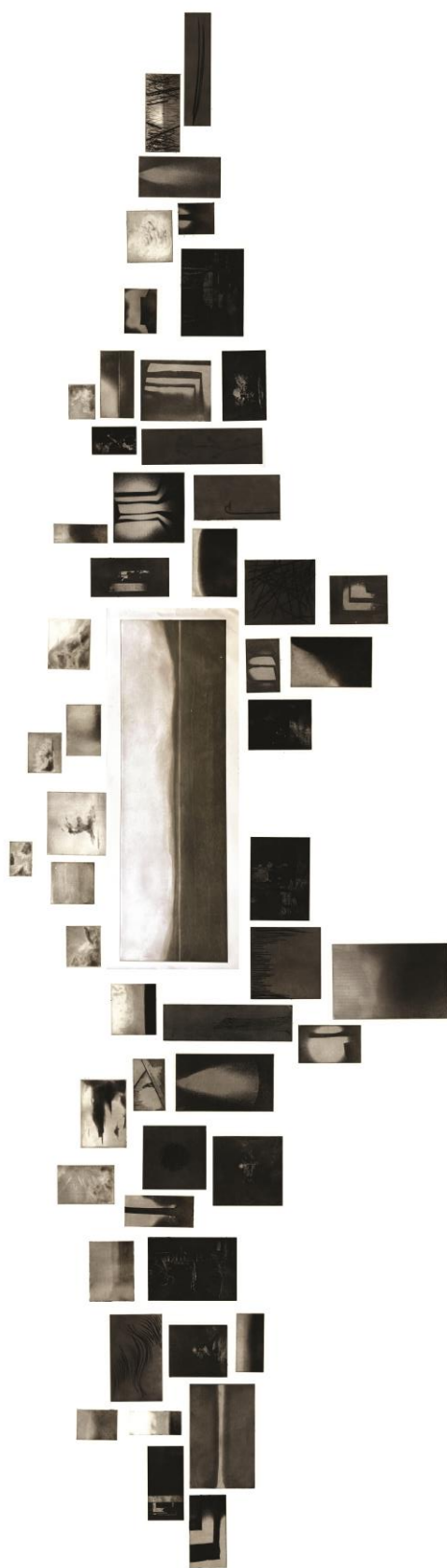
( slika 8., rekonstrukcija rada „Iz melankoličnog dnevnika“ )