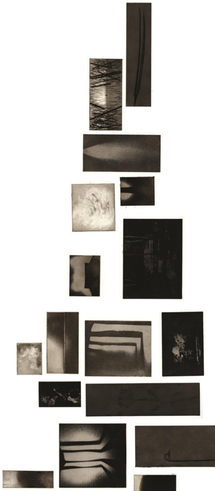
(slika 9. detalj desnog dijela rada)