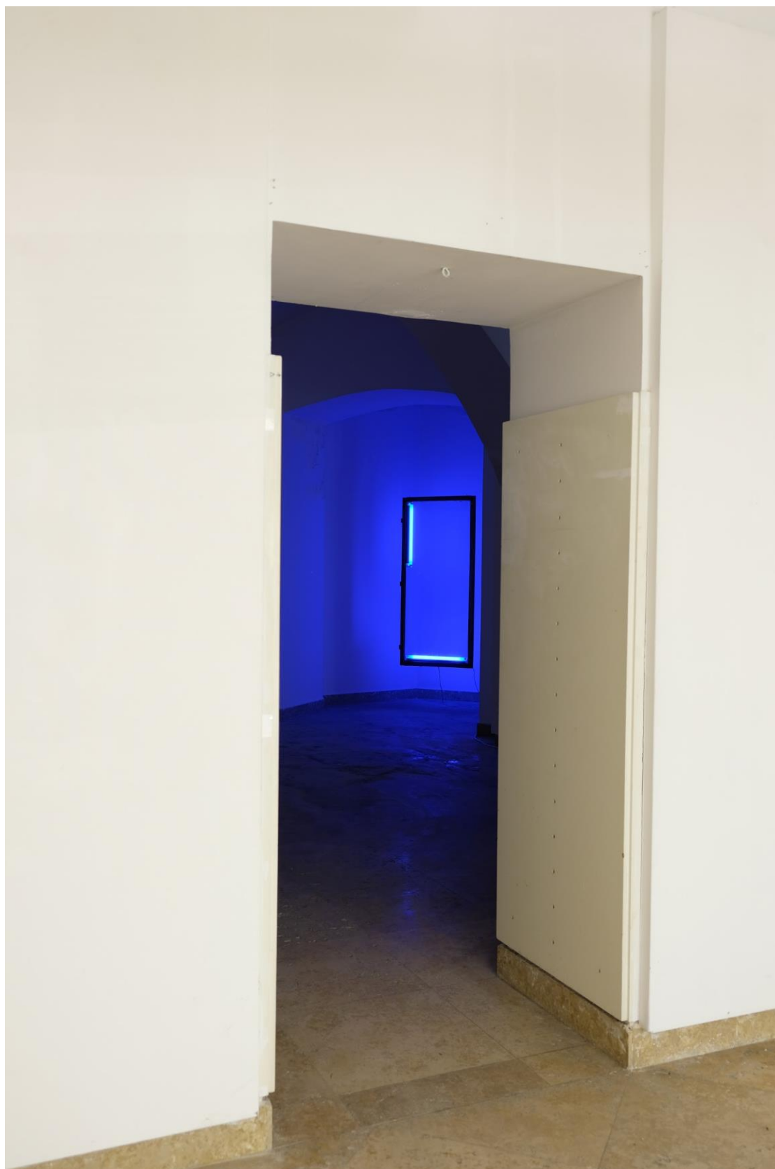
Slika 8 -plavetnilo- , 2019, detalj Instalacija od prozora; 160 cm x 75 cm i dvije UV-fluorescentne cijevi; 60 cm