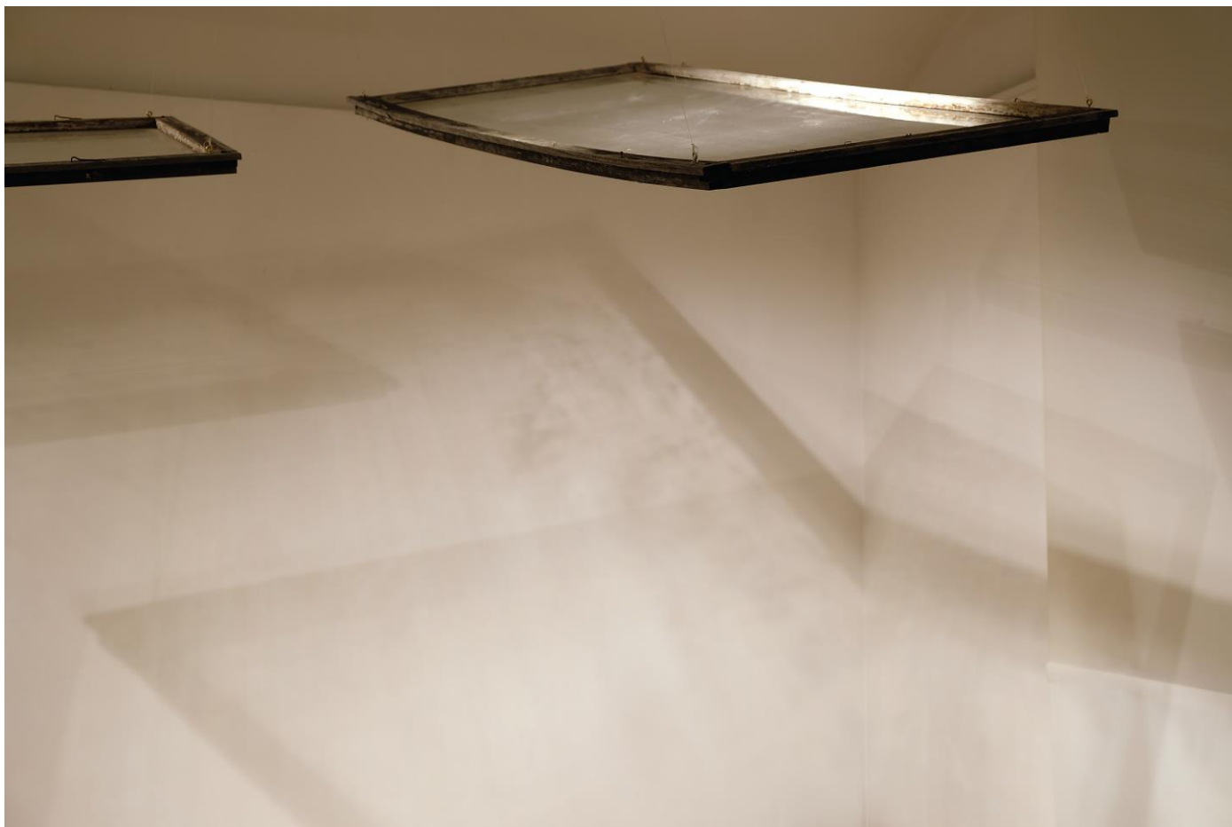
Slika 5 SM LET , 2019, detalj Instalacija promjenjivih dimenzija; 3 prozora; 160 cm x 75 cm, flaks