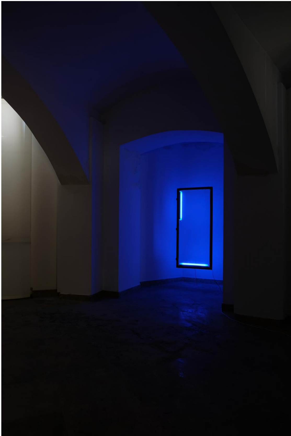
Slika 9 -plavetnilo- , 2019 Instalacija od prozora; 160 cm x 75 cm i dvije UV-fluorescentne cijevi; 60 cm