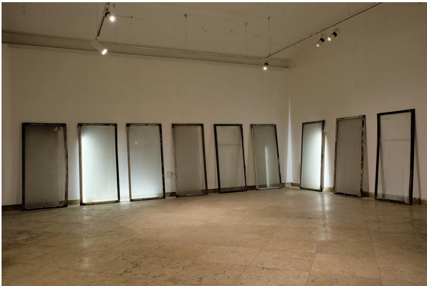
Slika 2 Soba s pogledom , 2019, detalj Instalacija promjenjivih dimenzija; 13 prozora; 160 cm x 75 cm, 3 neonske cijevi; 160 cm, 120 cm, 120 cm, 2 led cijevi; 120 cm, 120 cm