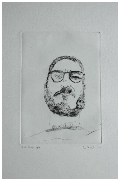
„Bez naziva“ 2019./2020., suha igla