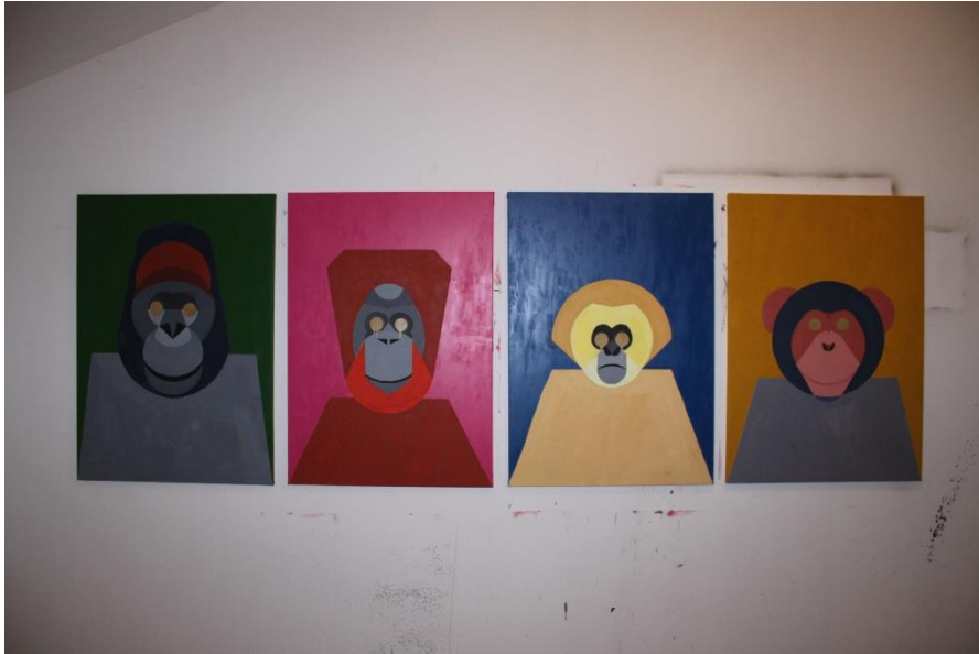
„Čovjekoliki majmuni“ 2019./2020., tempera, akril, akrilatni lak na platnu