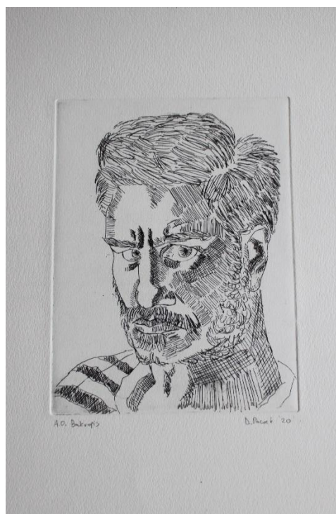
„Bez naziva“ 2019./2020., bakropis