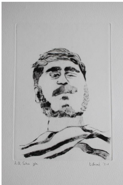
„Bez naziva“ 2019./2020., suha igla

odnosno odraz trenutnog duhovnog stanja koje se kroz autoportret može najbolje iščitati. Dva autoportreta nikada ne će biti ista i gotovo je nemoguće tako nešto ponoviti, pa čak i kada je duhovno stanje isto. To je u stvari ljepota autoportreta, to što on može iščitati i zabilježiti i najmanje promjene duhovnog stanja. U ovoj seriji autoportreta bavio sam se upravo time, a želio sam pokazati kako u određenom trenutku vidim sebe i na koji način to bilježim.