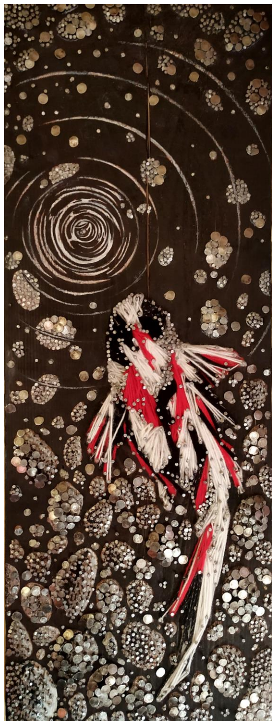
Lábor, 2020., reljef (drvo, čavli, vuna)