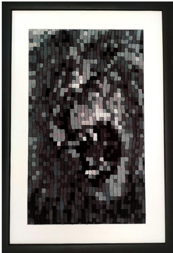
Ordo, 2020., konac/platno