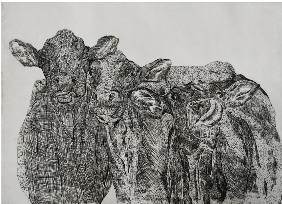
Disciplína II, 2020., bakropis