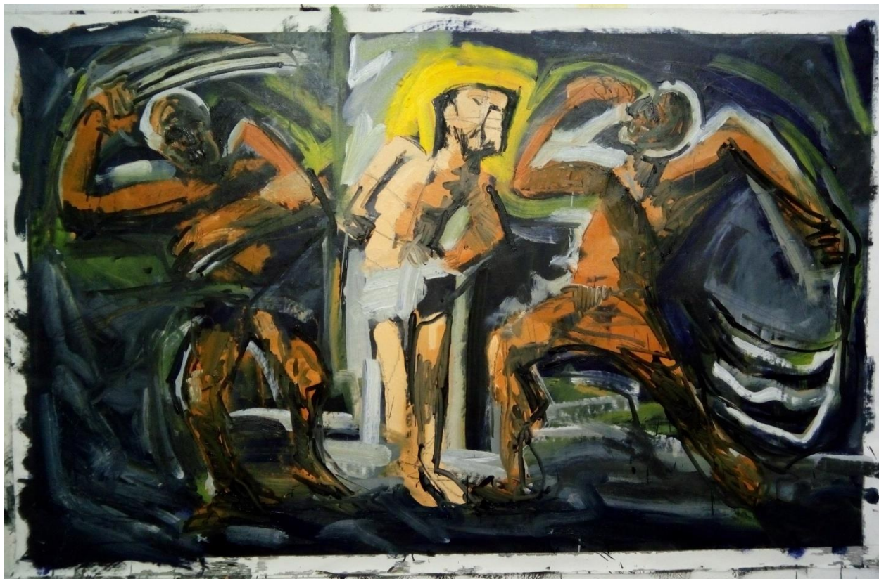
5. slika, faza slikanja uljenim bojama 2. verzije Bičevanja Krista

Nakon što sam linijama, oblicima i tonalitetom definirao kompoziciju, u ovoj fazi sam se počeo baviti problemom boja tako da sam na kraju pojednostavio svijest i koncentraciju na boje, ali ne isključivši ostale probleme jer se prilikom bojanja sve može promijeniti (pogoršati) te je nužno nešto ili sve revidirati. Nisam se potpuno opustio i oslanjao na dodavanje boja, no svejedno sam pojednostavio ne razbijajući glavu na ostala kompozicijska načela.