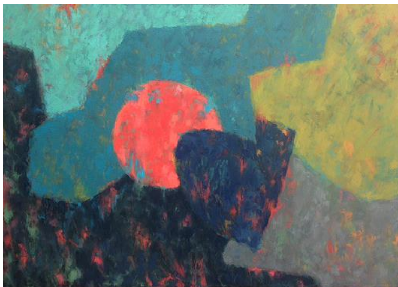
Slika 3. „Pomrčina“