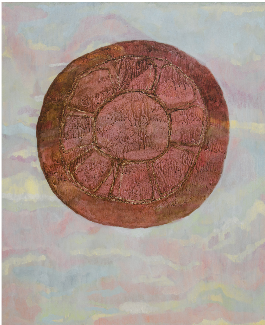
Abnegacija 1 100 × 81 cm akrilik, platno 2019.