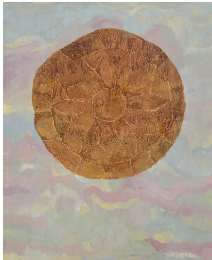
Abnegacija 2 100 × 81 cm akrilik, platno 2019.