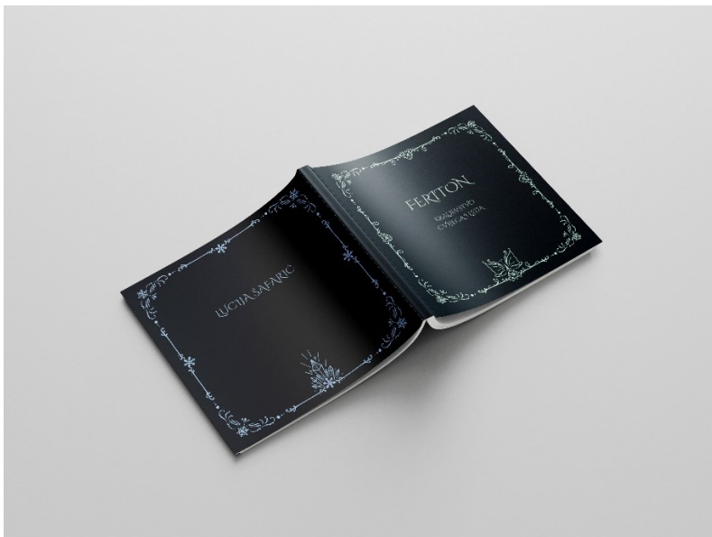
Slika 12. Mockup, korice artbooka