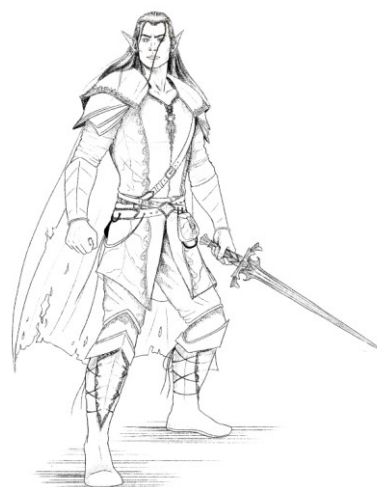
Slika 3. Finalna skica vilenjaka