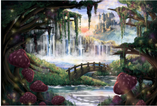
Slika 10. Finalna ilustracija pozitivnog okoliša