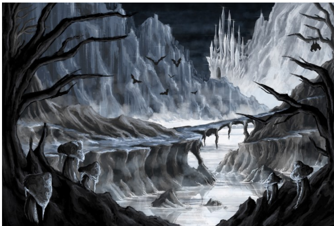
Slika 11. Finalna ilustracija negativnog okoliša