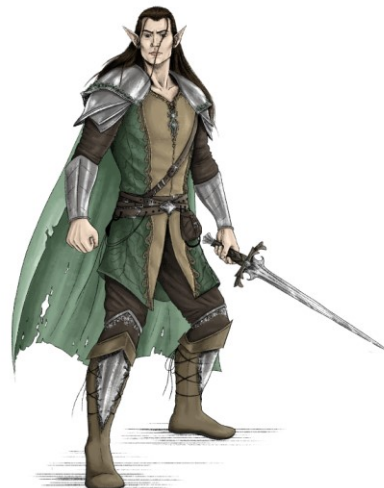
Slika 7. Finalna ilustracija vilenjaka