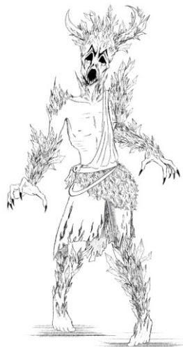
Slika 5. Finalna skica čudovišta