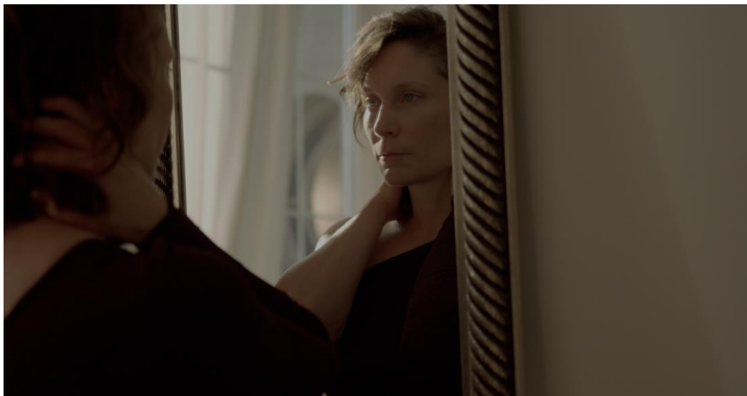
Kadar iz filma "Puls", 2024.