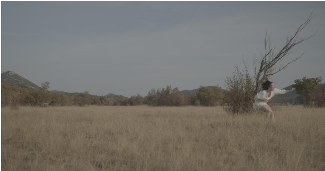
Kadar iz filma “Puls”, 2024.