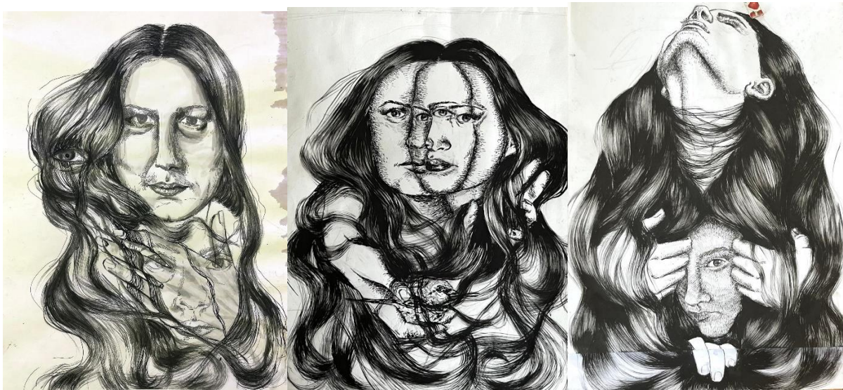
Crtež 1: „Zaštita“

Crteži predstavljaju prvu fazu, nacrtani su na papiru dimenzija 297x420 mm (A3 format). Koristila sam flomastere za tehničko crtanje debljine 1-3 mm, kako bih dobila fini raster 5 , kojime sam izradila volumen lica, ruke i ptice (kasnije bakropis) i crni tuš kojeg sam nanosila debelim, suhim kistom, kako bih prikazala kosu i njenu formu (kasnije bakropis i rezervaš).