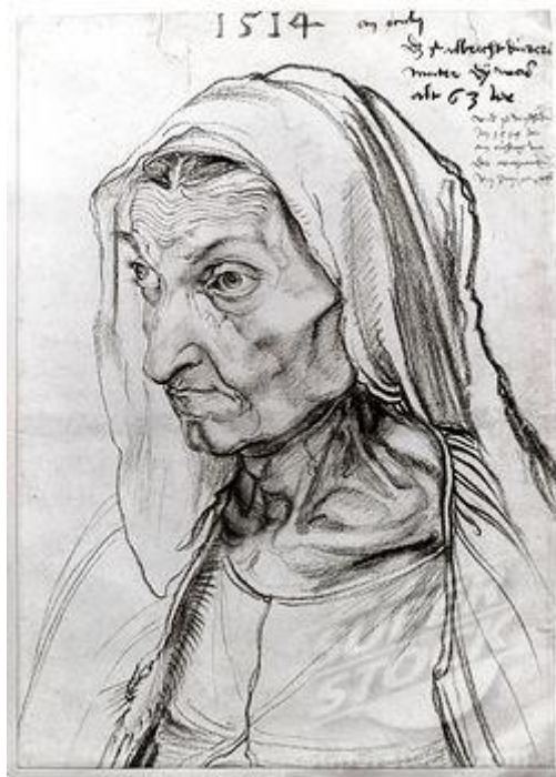
Albrecht Dürer, „ Portret majke “, 1514.

Primjer intimnog portreta je Dürerov „ Portret majke “, koji prenosi objektivnu istinitost na najvišem nivou, teži da je portret njegove majke likovno i psihički originalan. 6