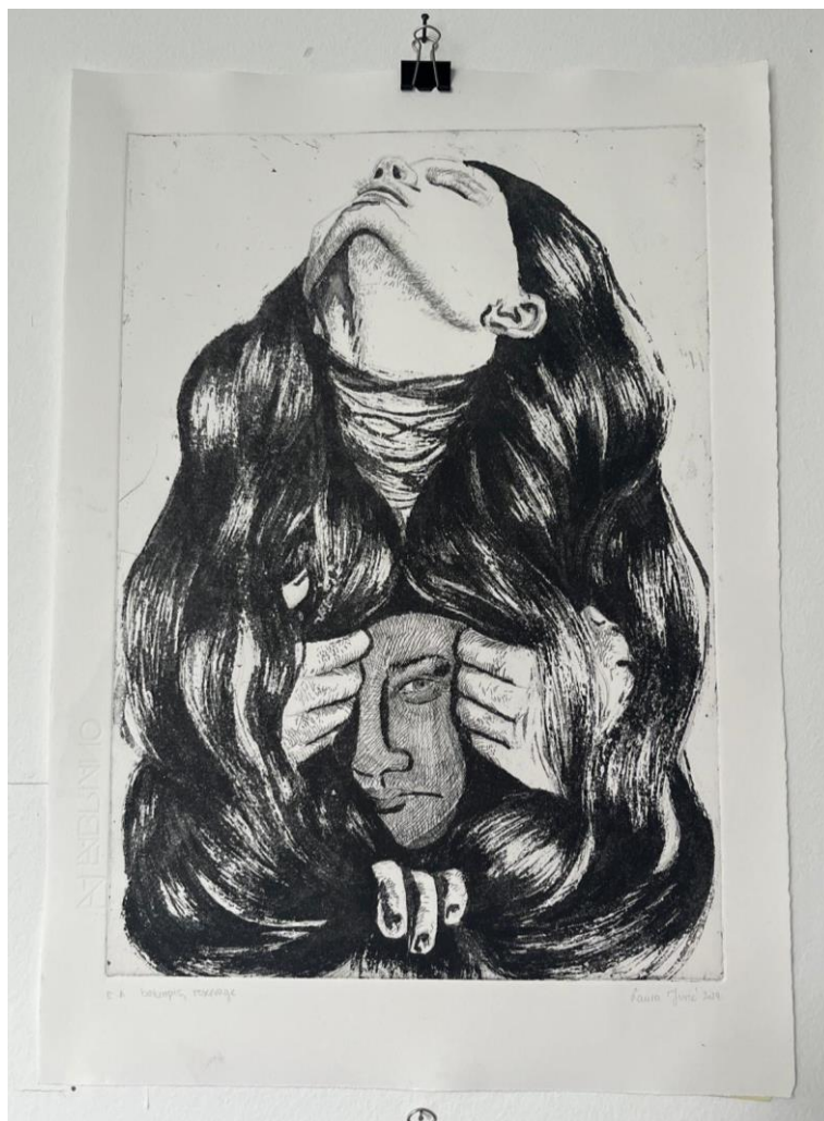
Matrica 3: „Utjecaj“, završni otisak

Kosa ponovno simbolizira povezanost i trajnost odnosa, naglašavajući kontinuiran rast i razvoj prijateljstva. Rad prikazuje zajednički rast i razvoj, naglašavajući kako su iskustva i utjecaji jedne na drugu oblikovali naše osobnosti.