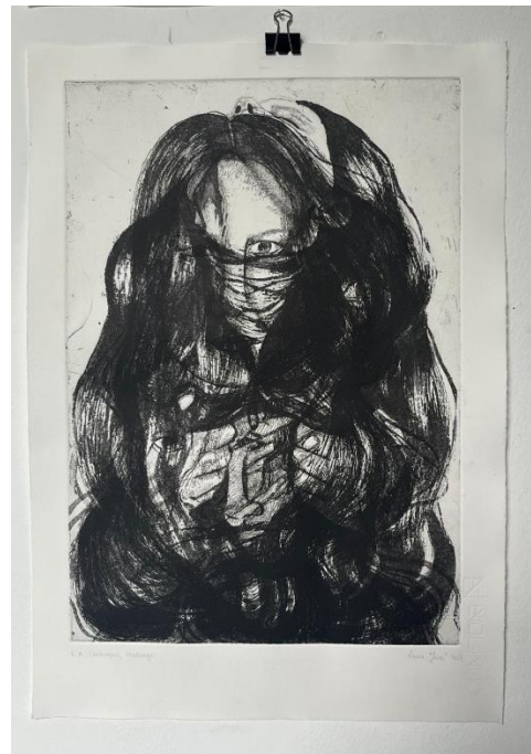
Zaštita i Utjecaj“, završni otisak