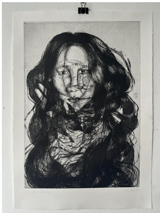
„Zaštita i Sloboda“, završni otisak

Ovi novi radovi vizualno prenose kako su se odnosi preplitali i transformirali kroz različite faze života, naglašavajući dinamičku prirodu ljudskih veza i njihov utjecaj na formiranje identiteta. Preklapanjem simbola, poput kose, ruku i ptice, stvorena je narativna tekstura koja dodatno obogaćuje razumijevanje psiholoških i emocionalnih aspekata tih odnosa.