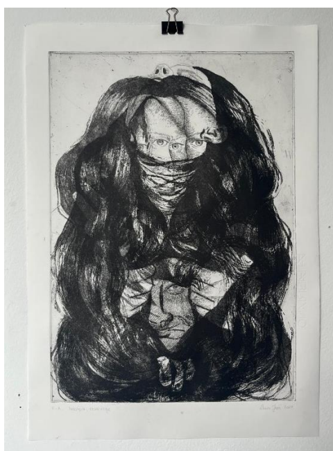
„Sloboda i Utjecaj“, završni otisak