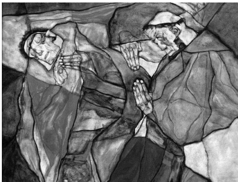
Egon Schiele, „Agonija“, 1912.

Egon Schiele, austrijski slikar i grafičar, poznat je po svom ekspresionističkom stilu, izražajnim linijama i često distorziranom prikazu ljudske figure. Svoj rad povezujem s njegovim jer i njegovi portreti i autoportreti otkrivaju unutarnje stanje modela. Kao i u Schieleovom, i u mom radu su prisutni alegorijski portreti/autoportreti. Schieleova djela često istražuju osobne i intimne teme, što je prisutno i u mome radu kroz prikaz odnosa s majkom i prijateljicama. 9