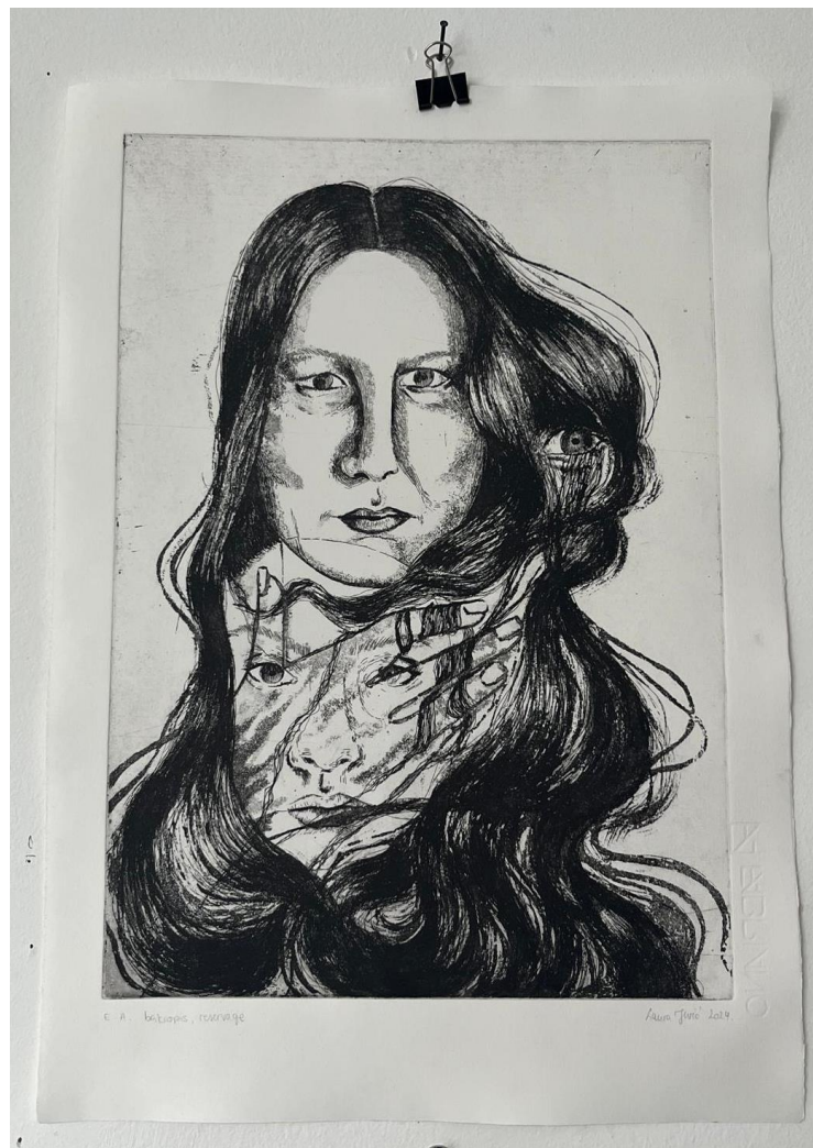
Matrica 1: „Zaštita“, završni otisak

Pogled prijateljice je vrlo bitan i upečatljiv, te se u gornjem desnom kutu nalazi njeno oko iz djetinjstva, naglašavajući nježnu stranu. Kosa dviju figura potpuno je isprepletana, sugerirajući nerazdvojnu povezanost dviju prijateljica. Tema prijateljstva istražena je kroz simboliku zaštite, povezanosti i zajedničkih iskustava.