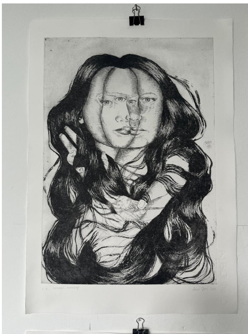
Matrica 2: „Sloboda“, završni otisak

Iako u radu nema moga autoportreta, djelo istražuje utjecaj majke na mene, sugerirajući kako su majčina zarobljenost i samosabotaža imali duboki psihološki utjecaj na mene kroz odrastanje.