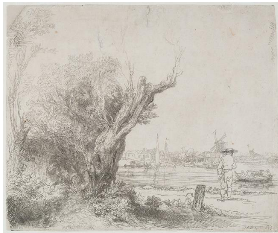
Rembrandt Harmenszoon van Rijn, „Vrba“, 1645.

Bakropisne linije imaju moć da vrlo precizno i profinjeno opišu određeni motiv, pruža se mogućnost za mekoćom i nježnošću, što se vidi iz radova starih bakropisaca. 3