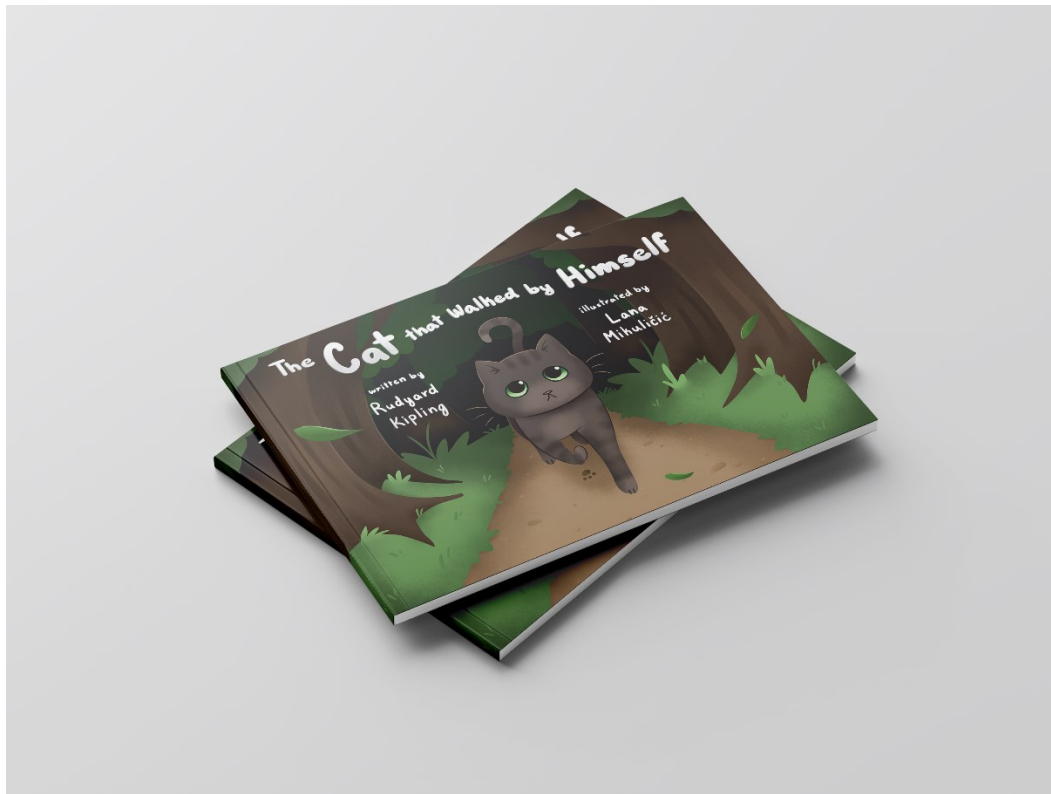
Slika 1. Mockup naslovnice

Odabrala sam ovu priču jer Kiplingovo pisanje smatram privlačnijim od mnogih klasičnih bajki. Vjerujem da bih, da sam ovu priču čitala kao dijete, također doživjela lik mačke ili žene mnogo simpatičnijima i srodnijima od protagonista drugih klasika. To je zahvaljujući Kiplingovom duhovitom stilu pisanja i šarmantnoj karakterizaciji likova. Zbog toga mi je primarni cilj u izradi završnog rada bio, kroz svoje ilustracije, prenijeti taj šarm i humor izvornog teksta.