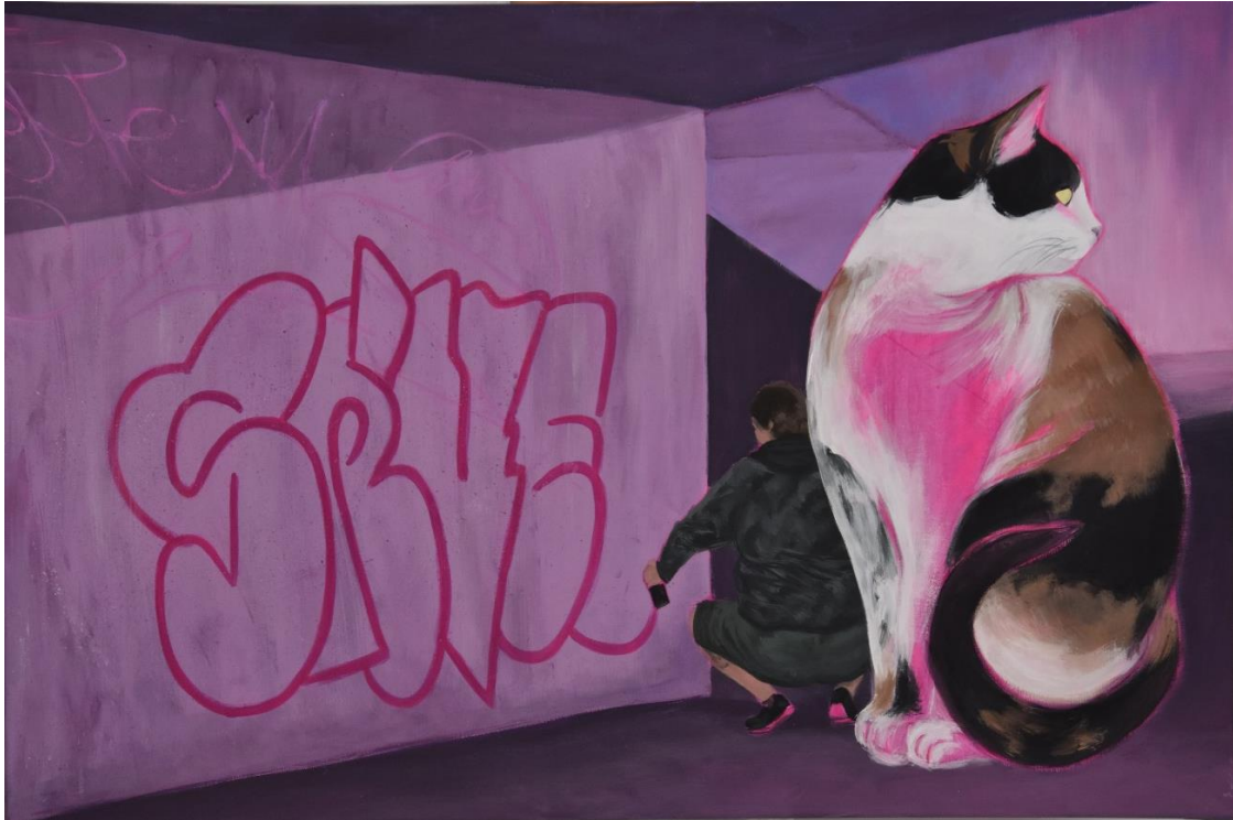
Mijić, L., Noćne šetnje #3, 120x80 cm, akril na platnu, 2024.