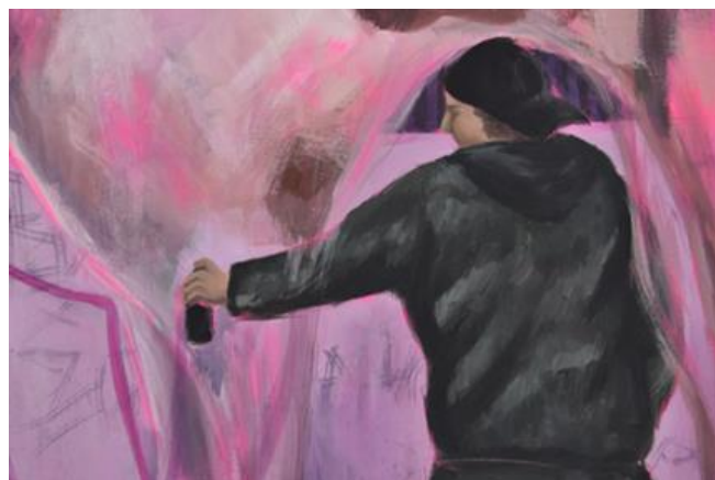
Mijić, L., detalj Noćne šetnje #1, 120x80 cm, akril na platnu, 2024.