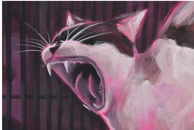
Mijić, L., detalj Noćne šetnje #1, 120x80 cm, akril na platnu, 2024.